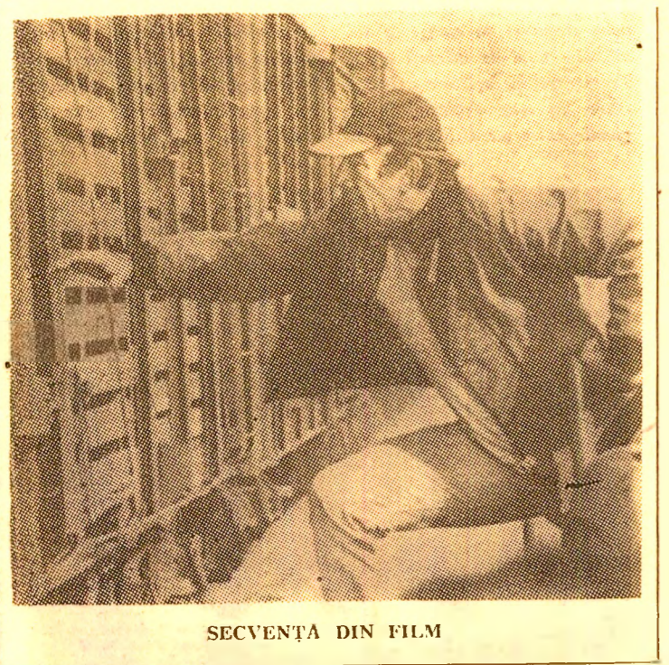
SECVENȚA DIN FILM