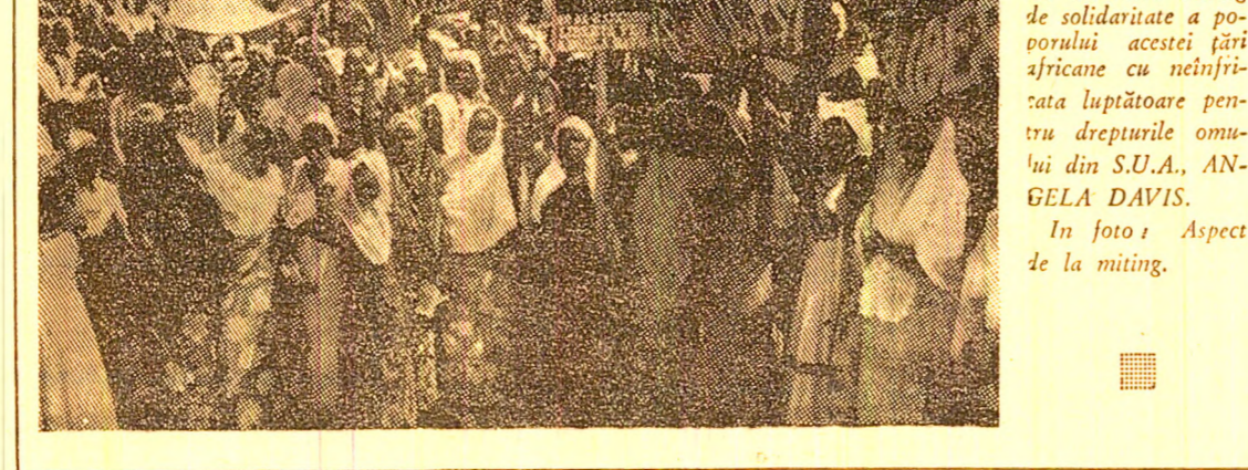
SOMALIA. În Mogadisho — capitala somaleză — a avut loc un mare miting de solidaritate a poporului acestei țări africane cu neînfrînta luptătoare pentru drepturile omului din S.U.A., ANGELA DAVIS. În foto: Aspect de la miting.

Angela Davis primește zilnic aproximativ 1 000 de scrisori de solidaritate și de simpatie din întreaga lume. Acum, toți americani o cunosc, și pentru milioane dintre ei Angela a devenit un simbol al luptei pentru dreptate al rezistenței. Știndînt îngreșat tratamentul la care a fost supusă în timpul detenției, Angela Davis mi s-a spus niciodată de concepțiile privind condamnarea rasismului, a războiului din Vietnam, necesitatea unor transformări importante în viața politică a S.U.A.”.