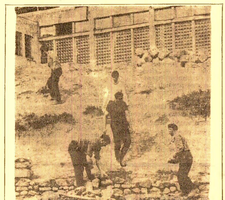
Cețeni ai carierului Aerport la muncă patriotică pentru îndiguirea canalului piriului Slatinoara