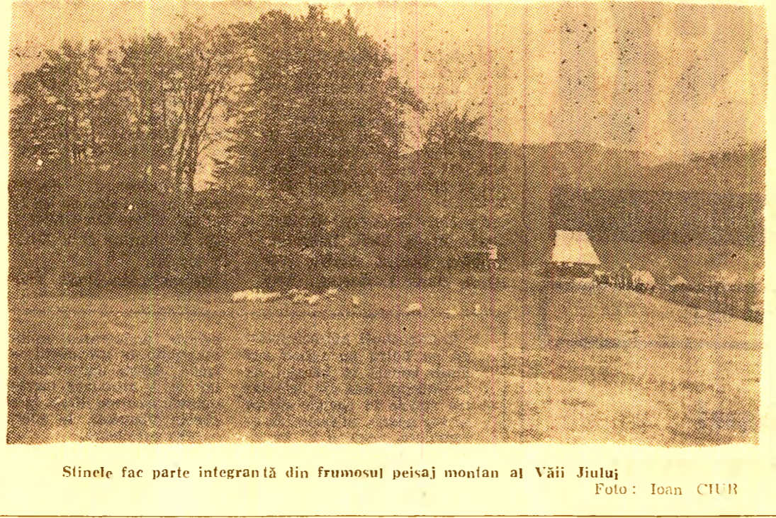
Sinele fac parte integrantă din frumosul peisaj montan al Văii Jiului.

(Urmare din pag. 1) rata medie de creștere în Europa a fost, în această perioadă, de 7,3 la sută. Pentru cincinalul 1971 - 1975 ritmul mediu de creștere a turismului internațional din țara noastră se conturează a fi de 17 la sută.