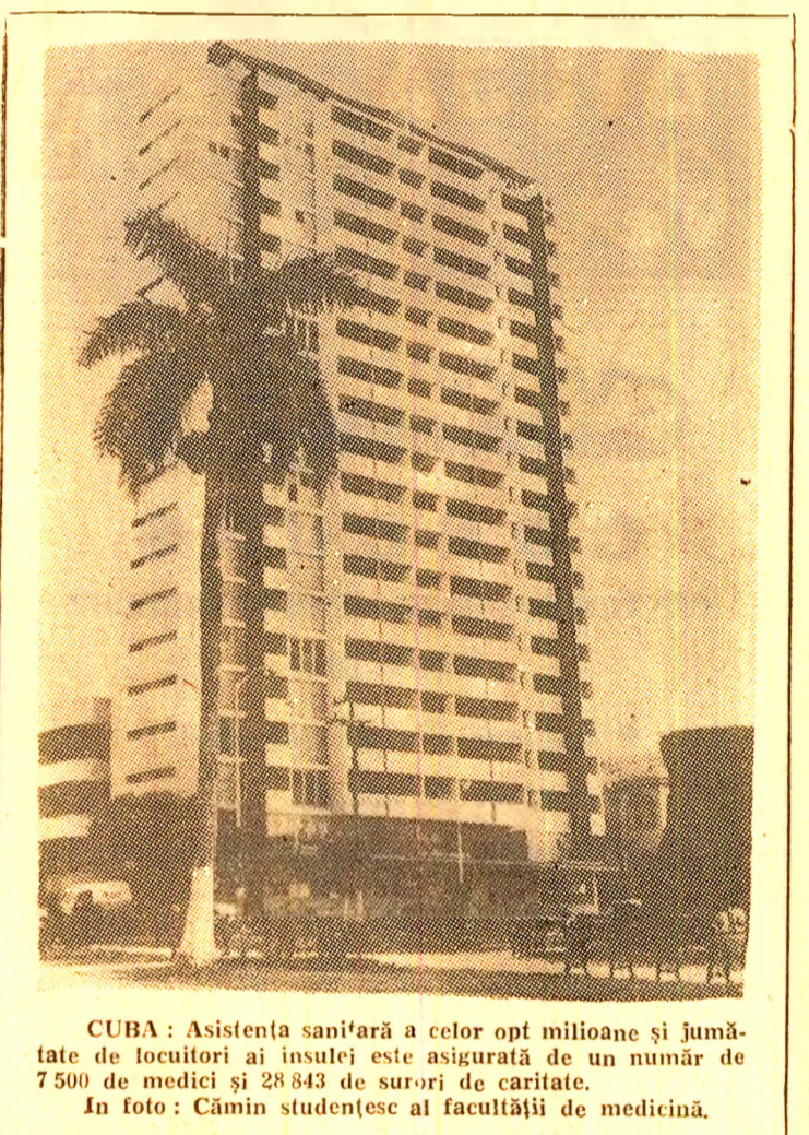
CUBA: Asistența sanitară a celor opt milioane și jumătate de locuitori ai insulei este asigurată de un număr de 7500 de medici și 28.843 de surori de caritate. În foto: Cămin studentesc al facultății de medicină.

SOFIA 23 (Agerpres). — Fidel Castro Ruz, prim-secretar al C.C. al P.C. din Cuba, primul ministru al Guvernului Revoluționar, care se află într-o vizită oficială în R. P. Bulgaria, a fost marți oaspetele localității Ruse. Fidel Castro a fost însoțit de Teodor Jivkov, prim-secretar al C.C. al P.C. Bulgar, președintele Consiliului de Stat. Fidel Castro, relevă agenția BTA, a avut o întrevvedere cu cadre de conducere locale, care au informat despre preocupările privind dezvoltarea orașului Ruse, și a vizitat, apoi un centru electronic de calcul și o expoziție special organizată, care prezintă aspecte ale aplicării sistemelor automate de calcul.