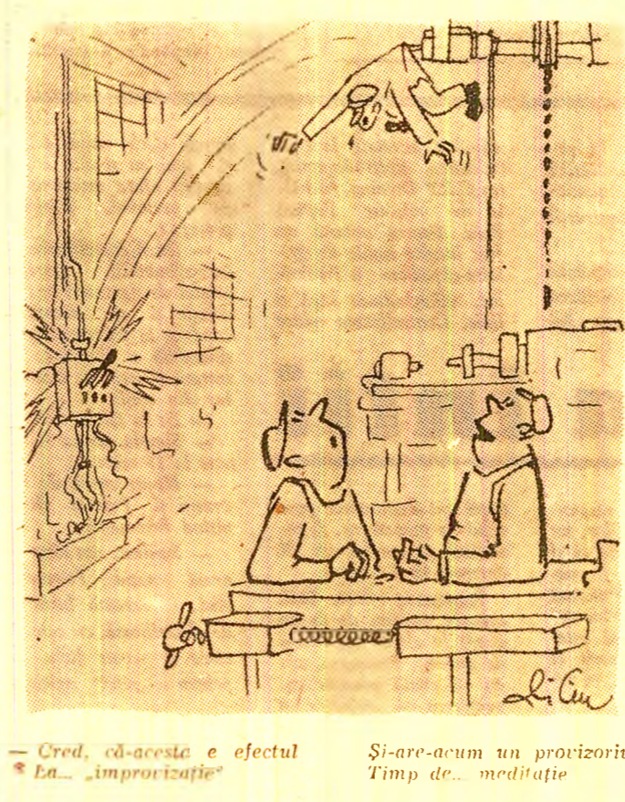
— Cred, că-aceste e efectul „La... improvizatie” și-aro-acum un provizoriu timp de... meditație

♦ să ia măsurile ce se impun împotriva tuturor acțiunilor care încăleacă normele de p.c.i.