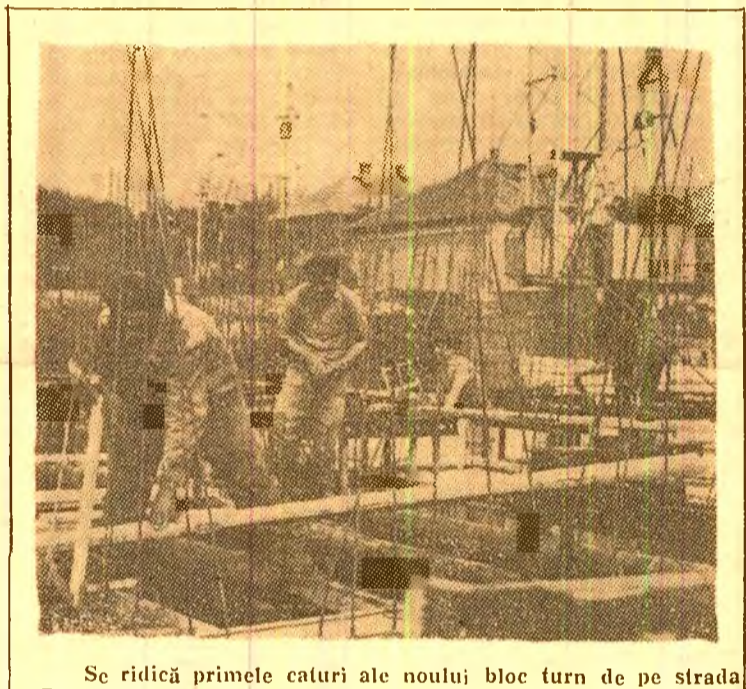
Se ridică primele etajuri ale noului bloc turn de pe strada Republicii din Petrosani.