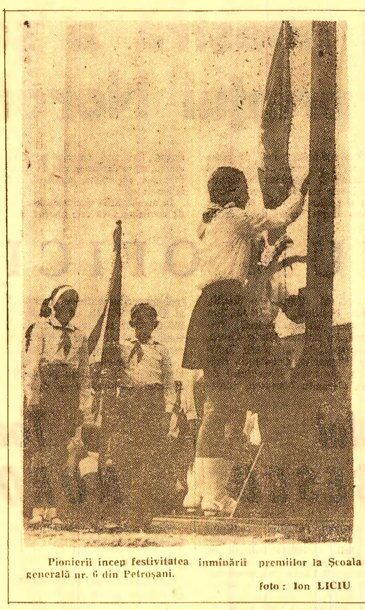
Pionierii încep festivitatea înmărmării premiilor la Școala generală nr. 6 din Petroșani.