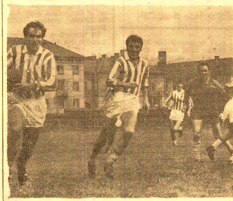
Echipele Știința Petroșani și Grivița Roșie în timpul meciului de rugby.