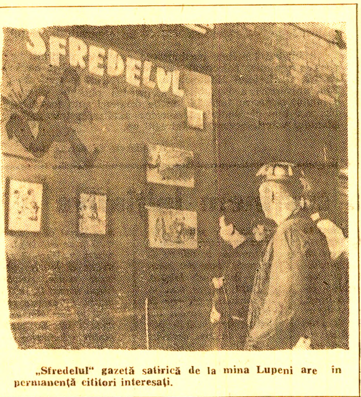
„Stredeul” gazetă satirică de la mina Lupeni are în permanență cititorii interesați.

Pagină realizată de C. MAGDALIN Ilustrația I. LICIU