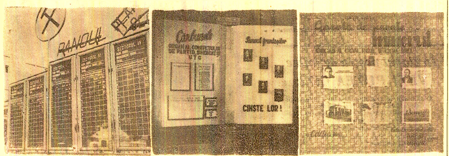
Panoul realizărilor de la mina Vulcan. Frumos, dar ce folos?... Gazeta de perete de la aceeași mină. La fel, frumoasă, dar... „Și sora ei gemănă, de la mina Paroseni.