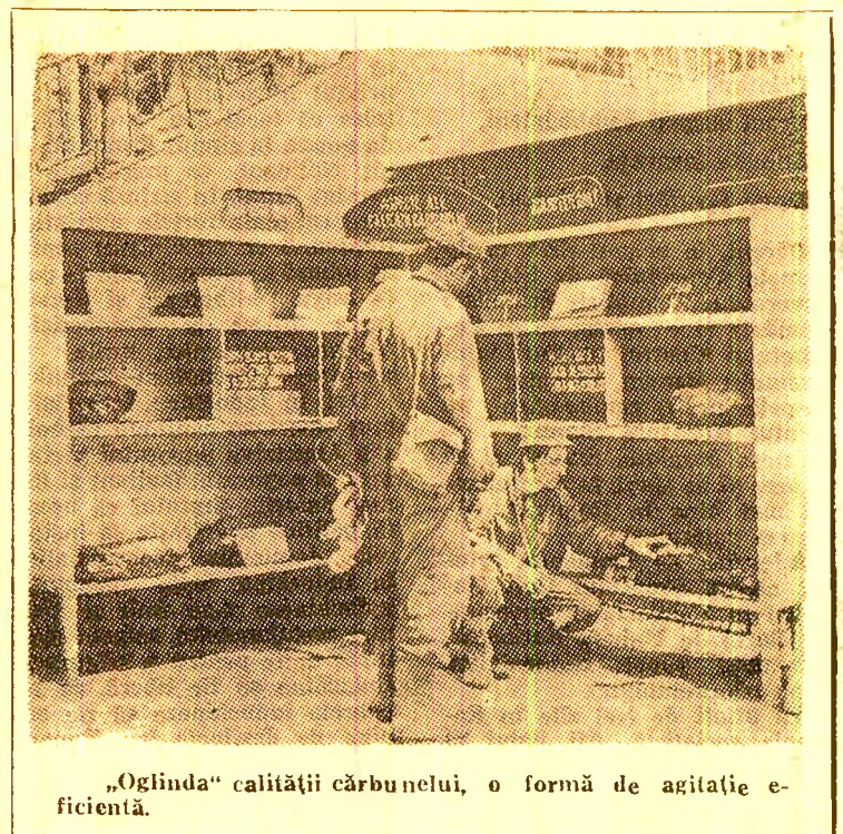
„Oglinda” calității cărbunelui, o formă de agitație eficientă.

Dar nu numai tratarea și combaterea lipsurilor este caracteristică agitației vizuale, muncii politice de masă la mina Lupeni. În ziua când am făcut investigația la această mină am avut satisfacția să constatăm că am văzut oameni dis-