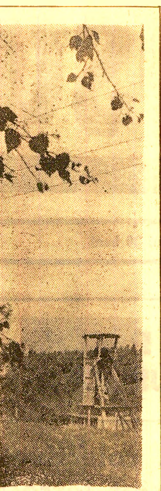
La mina din deal.