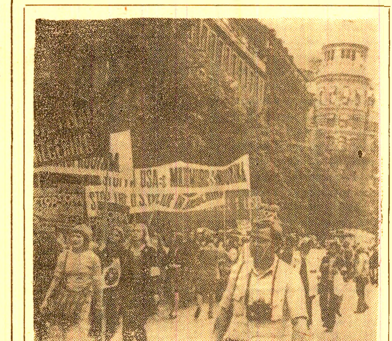
SUEDIA: La Stockholm, a avut loc o demonstrație de protest împotriva războiului din Vietnam. Cei aproximativ 8.000 de demonstranți s-au pronunțat pentru retragerea imediată și necondiționată a trupelor americane din Indochina și pentru recunoașterea de către Suedia a Guvernului Revoluționar Provizoriu al Republicii Vietnamului de Sud.

CAMBODGIA 23 (Agerpres). — Potrivit relatării agenției khmerek de informații (A.K.I.), în cursul unor operațiuni ofensive desfășurate în primele două săptămîni ale lunii iunie, forțele armate populare de eliberare națională din Cambodgia au scos din luptă 420 militari ai regimurilor marionetă de la Pnom Penh și Saigon, au distrus 6 blindate M-113 și au capturat