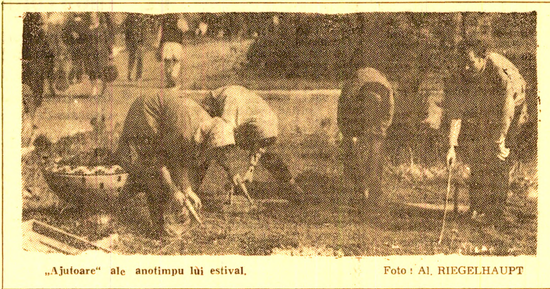
„Ajutoare” ale anotimpului estival.