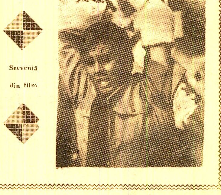
Seventă din film

lei poziții ce se află concentrată în expresia populară „nu mă bag”. Premiul în 1968 la două importante festivaluri, filmul rulează la cinematograful „7 Noiembrie” din Petroșani.