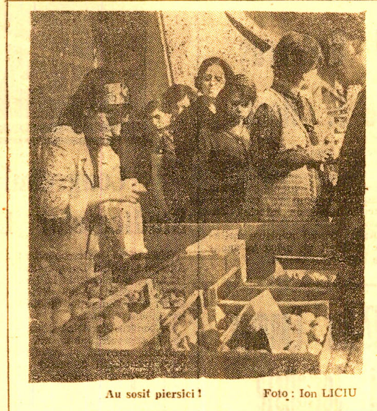
Au sosit piersici!

Încheind săptămâna „Sarmis” festivalul fanfarelor (la a cărei desfășurare, cele locale au avut, totuși, cea mai de seamă contribuție) a prilejuit și o verificare a lor. Este momentul ca aceste formații să fie urmărite îndeaproape și solicitate să contribuie mai intens la viața muzicală a municipiului, la care participarea lor în momentul de față este nesemnificativă în comparație cu posibilitățile existente.