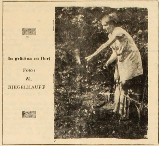
În grădina cu flori