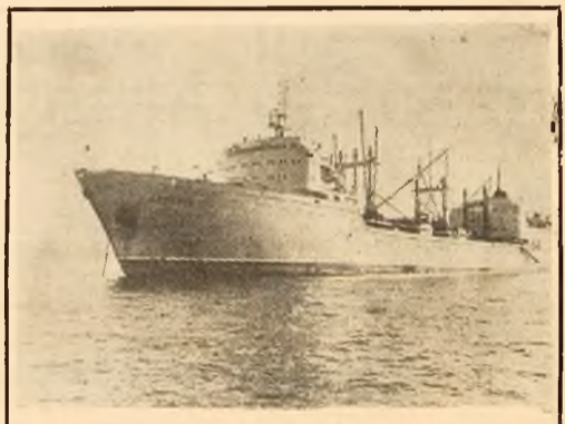
U.R.S.S.: Recent flota sovietică de pescuit din Kamiatka s-a îmbogățit cu „Arctica” o uriașă uzină plutitoare de prelucrare a peștelui.

ultimul timp, comandamentul militar a încercat chiar să determine echipele unor nave staționate în porturile din Okinawa să intre și să acționeze în apele teritoriale ale R. D. Vietnam.