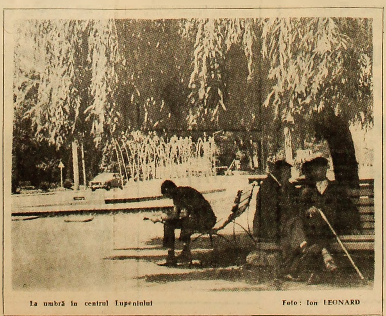
La umbră în centrul Lupenului