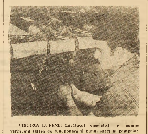
VISCOZA LUPENI: Lăcătușul specialist în pompe verificînd starea de funcționare și bunul mers al pompei.