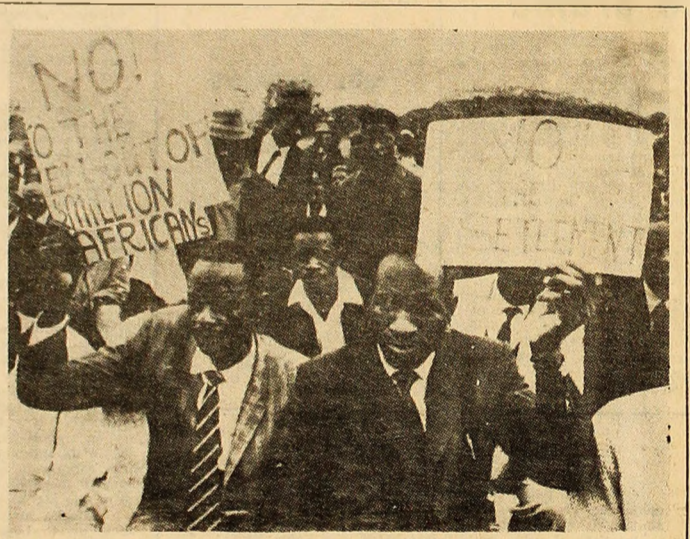
Populația neagră în Rhodesia arătându-și dezacordul asupra Tratatului anglo-rhodesian.

Guvernul britanic nu și-a ascuns niciodată intenția de „normalizare” relațiilor sale cu guvernul rasist a lui Ian Smith. După semnarea Tratatului anglo-rhodesian și după ce populația de culoare și-a manifestat violent nemulțumirea, a fost trimisă în Rhodesia o comisie britanică condusă de Lord Pearce, cu misiunea de a cerceta situația populației negre la fata locului. Rezultatul sondajelor n-a fost cel scontat de autorități. Comisia Pearce a subliniat în raportul său că: „populația Rhodesiei în ansamblul său, nu consideră că propunerile (din tratat) să fie acceptate ca bază pentru pregătirea independentei”. În Rhodesia stau față în față 5 milioane de negri și 240.000 de albi, în majoritate rasisti, aceștia din urmă având în mână toate posturile cheie ale conducerii. Populația neagră a cărei conștiință politică a făcut uimitoare progrese în ultimii ani, știe azi că trebuie să se afirme cu toată forța spre a obține drepturile politice și civile care îi se cuvin. În foto: Populația neagră în Rhodesia arătându-și dezacordul asupra Tratatului anglo-rhodesian.