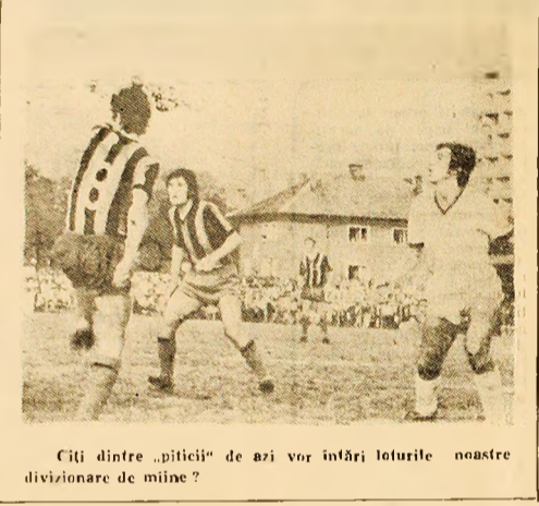
Ciți dintre „piticii” de azi vor înfrâna loturile noastre divizionare de mine?