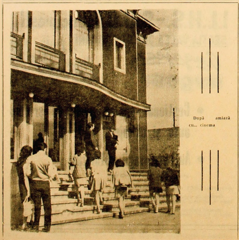
Dupa amiază cu... cinema

— Să subliniem că pe alocuri vacanța de vară nu e a „clevilor“.