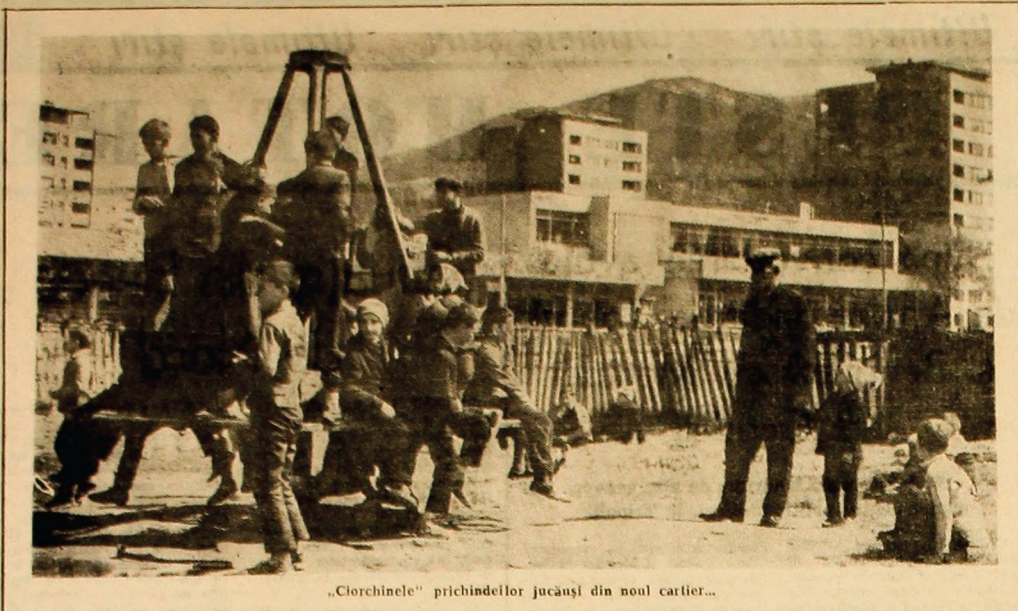
„Clorchinele” prichindelor jucăși din noul cartier...