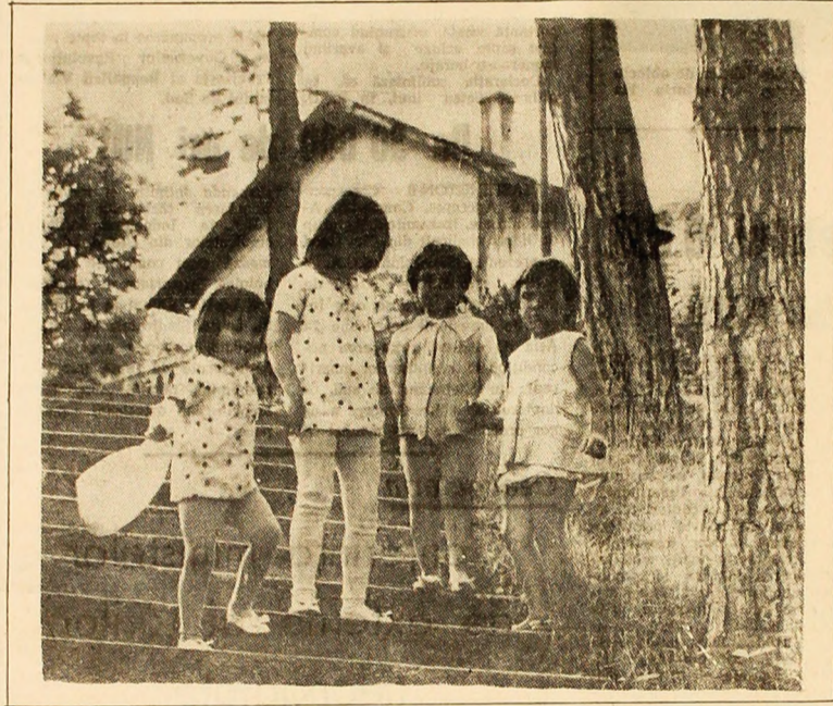
Stăți, fetelor, că neșea ne face o fotografie...

Am reținut din proiectul Codului Muncii un anume paragraf. îl revoiez, și îl adresez spre știință, atâștătorilor înserați mai sus, și alora cu ei, singuri la părinți, singuri în quadranți. Deci, spre știință, art. 18, cuprinzător, binevoitor „IN-SUSIEREA SUB ORICE FORMĂ A MUNCII ALTHIA ȘI TOATE MANIFESTĂRILE DE PARAZITISM SOCIAL, SINT INTERZISE CA INCOMPATIBILE CU O-RINDUIREA SOCIALISTĂ, CU PRINCIPILE ETICE ȘI ECHEITĂ-ȚII SOCIALISTE”.