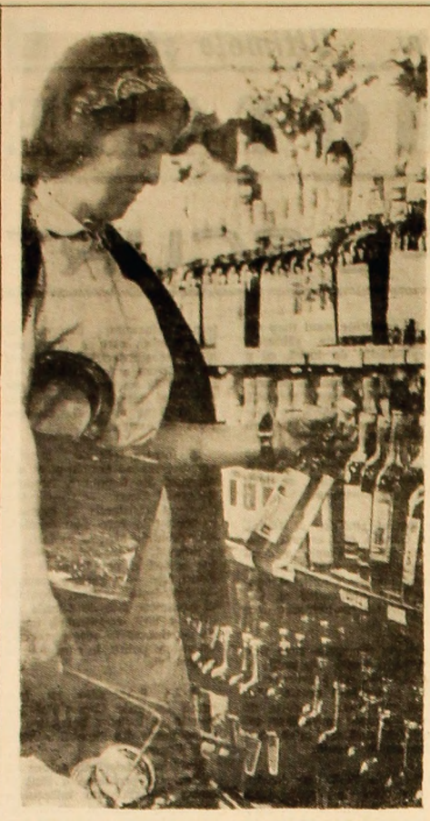
Nebolărită (la autoservirea din cadrul Complexului comercial petrolian).