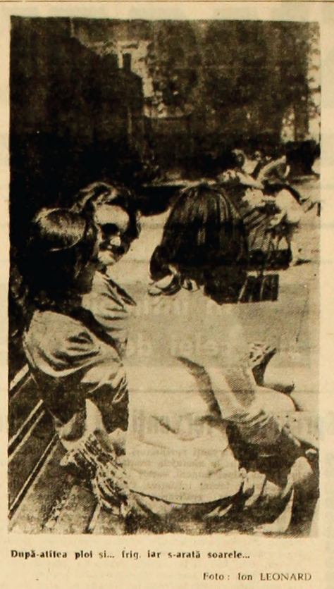
După-alteia ploii și... frig, iar s-arată soarele...

În paginile revistei Era socialistă vor fi prezentate cu regularitate rubrici speciale destinate celor ce studiază în diverse forme de învățămînt, studii și eseuri privind dialectica dezvoltării societății socialiste, filozofia, sociologia, istoria.