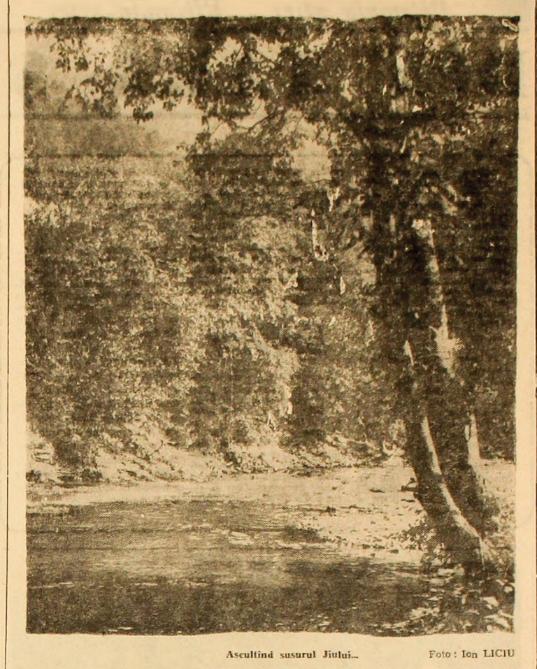
Ascultînd susurul Jiului...