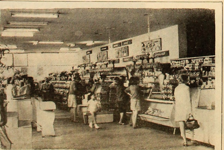
Comerțul modern... la el acasă