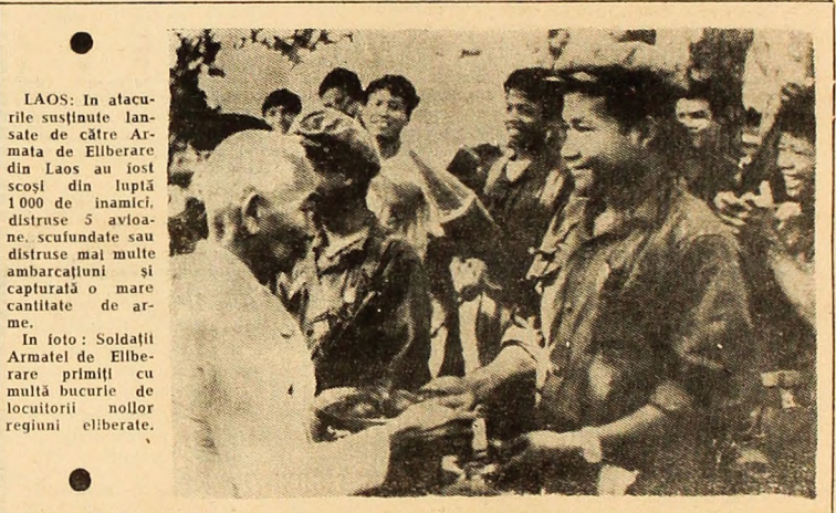
LAOS: În alacurile susținute lansate de către Armata de Eliberare din Laos...