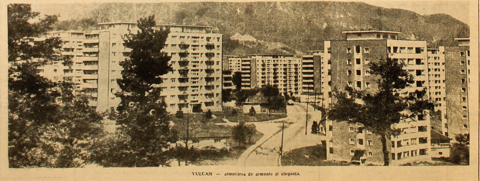
VULCAN — atmosfera de armonie și eleganță.