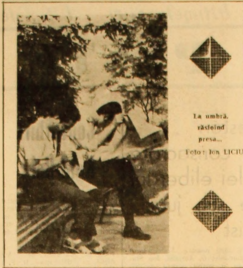
La umbră, răscolind presa...