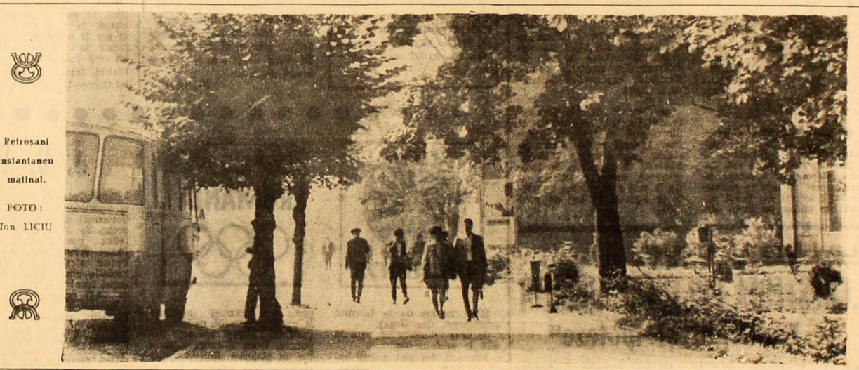
Petroșani Instantaneu malnal.

ciere a analizei economice cu ajutorul modelelor intrare-ieșire. Ioșif Pălan — Cunoașterea politicii de import a partenerilor comerciali. EXPERIMENTE NAȚIONALE DE MODERNIZARE A STRUCTURII ECONOMICE. Dezbatere organizată de revista „Probleme Economice” (XV). DEZBATERI: x x x — Perfecționarea predării economiei politice în învățământul superior (I). x x x — Utilitatea aplicării metodelor și tehnicilor de marketing în economia noastră (III). x x x — Contradicțiile economiei capitaliste contemporane (IV). CONSULTAȚII: Petrache Buzoianu — Fondul național de dezvoltare — condițiile a progresului economico-social. CONJUNCTURA ȘI PROSPECTIVA: Fr. Szabo și Gh. Enache — Cerințele de progres în agricultură. ECONOMIE MONDIALĂ: Mihail Hăgeșanu — Schimbări semnificative în marea finanță internațională.