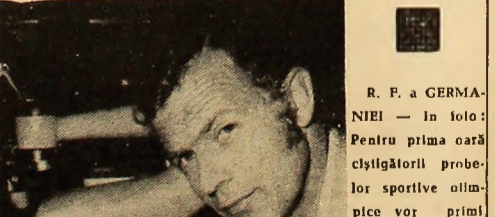
R. F. a GERMANIEI — În foto: Pentru prima oară clișajătorii probei sportive olimpice vor primi

urma unei reveniri puternice la poziția gonușchi, unde a obținut un rezultat valoros: 390 puncte. După disputarea poziției în picioare, Rotaru, care realizase 361 puncte (cu 15 puncte mai puțin decât rezultatele sale obișnuite), se afla pe locul 15 în clasamentul. Revenirea sa tardivă nu l-a permis însă să candideze la o medalie olimpică. Petre Săndor a ocupat în final locul 20, cu 1139 puncte. Clasamentul probei: 1. John Writer (S.U.A.) — 1166 puncte — medalia de aur; 2. Lanny Bassham (S.U.A.) 1157 puncte — medalia de argint; 3. Werner Lippoldt (R.D. Germană) — 1153 puncte — medalia de bronz; 4. Peter Kowarik (Cehoslovacia) — 1153 puncte; 5. Vladimir Aghișev (U.R.S.S.) — 1132 puncte; 6. Andrzej Sie-