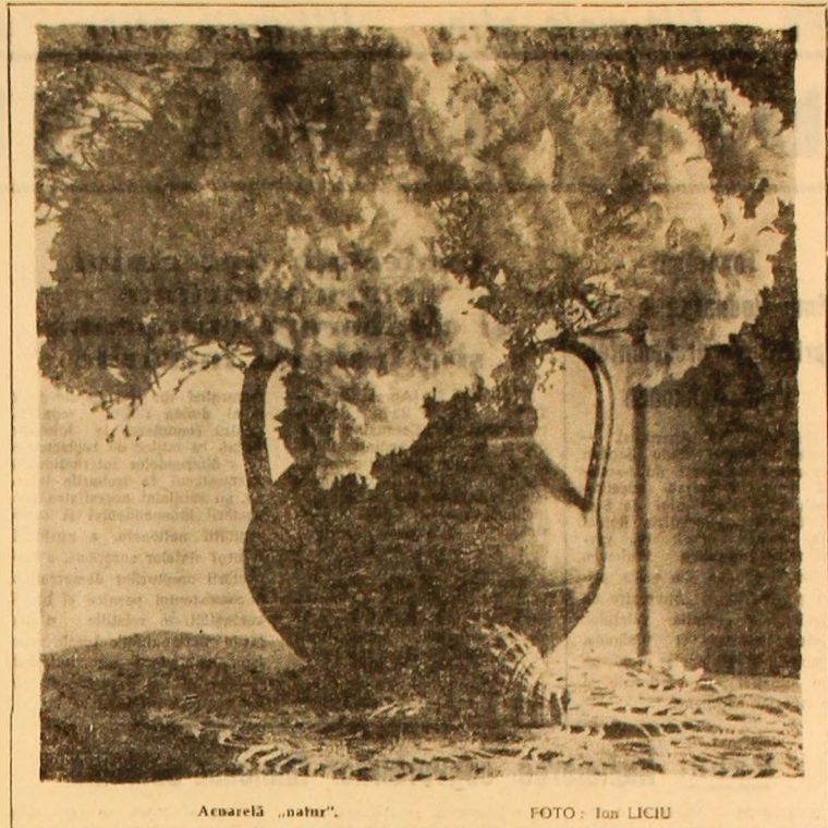
Acuarul „natur”.