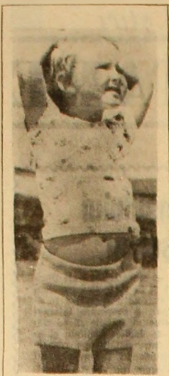
U!, că bine mai e cînd lasă soarele L...

Începută în anul trecut, în execuția Centralei cărbunelui prin Baza de aprovizionare și transport, indiguierea — printr-un zid de apărare din beton — a fost terminată recent, asigurându-se în acest fel unităților economice amenințate o centură de protecție împotriva inundațiilor.