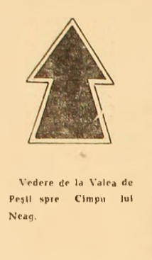
Vedere de la Valea de Pești spre Cimpul lui Neag.