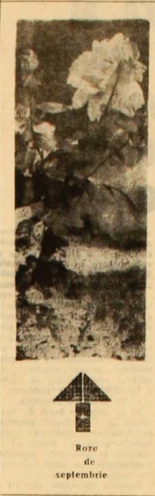
Roze de septembrie

În orice caz, eficiența schimbului II, acolo unde a fost introdus și unde se prevede a fi extins, este nemijlocit condiționată și de creșterea și concretizarea unor noi măsuri organizatorice — programare, încălzire, aprovizionare —, de întreprinderea unor acțiuni fertile, pentru ca forța de muncă și timpul de lucru de la obiectivele în execuție să fie folosite cu randamente superioare. Creșterea coeficientului de schimburi, a productivității schimbului înseși — numai așa se poate materializa în realizarea de obiective la timp și de calitate dorită. Așigurarea unor condiții de lucru optime, asemănătoare în toate schimburile reprezintă cheia de boltă a reușitei extinderii acestora pe șantiere.