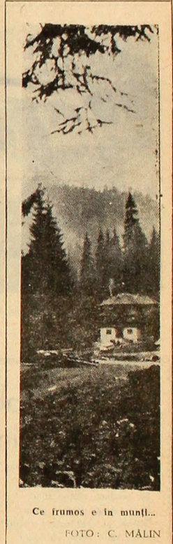
Ce frumos e în munți...