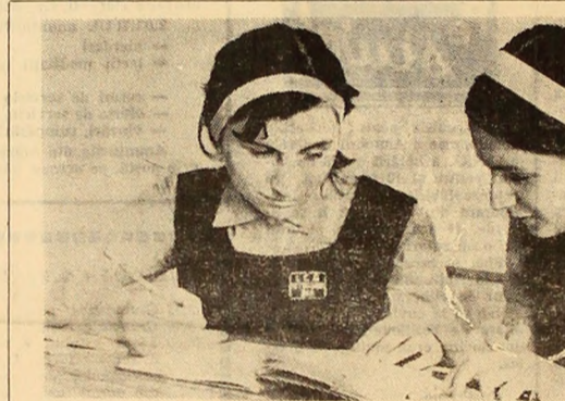
După ce clopoțelul a sunat intrarea în clasă...