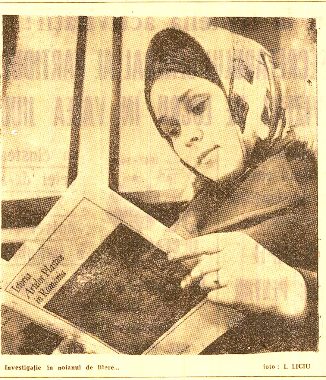
Investigație în nolanul de litere...

(Urmare din nr. 7120) Sub normîntul acela, în acea groază noaptea, se afla trupul unui om, trup în care, poate, mai pilpîia un strop de viață. Fiecare secundă avea acum prețul unei vieți. Fără să stoa pe gînduri, așezîndu-și hainele de pe ei, directorul și inginerul se îndreptară spre locul unde se afla trupul. Dar gîndurile nu erau alinate de nimic. Și cea mai aprigă bătaie dintr-o inimă de om și natura începu. Îlîpîi în mîntușele sfîrșite ale muntelui, fără să scoată o vorbă, scîldat în gîrle de sudoare, scrișînd între dinți praful mîntului de piatră ce răbătuse din toate părțile, lucrul cu puteri înecate și cîrăseală, drum spre mîntul luat, prin surprindere, prizonier de natură. Locul fînd foarte strîm, despre aducerea unui vagonet adăvărît nici nu putea fi vorba. Artificierul de orizont și-a goit lada de munții, l-a rîpl capatul, l-a legat în loc de oște o sîrma transformînd-o în vagonet. Nici dacă cei aflați acolo ar fi făcut un plan de lucru, nu s-ar fi muncit așa de rapid și organizat. U-măr la umăr cu palmele, cu două lopeți cărora li s-au scurtat cozile, „vagonetul” era umplut într-o clipită. Cîrăsose se retrăgea fără vorbă, făcînd comanda culva. Al-tu-l-lua locul, „Vagonetul” artificierului zbura tras de sîrmă de către „mînji” din abatajii sapte. Fugeau cu el zecă, cincisprezece metri, îl goleau și-l aduceau înapoi în fața surpării. Nici nu-și trăgeau bine răsufletea și „vagonetul” era din nou plin. O goană nebulină, neîntreruptă,