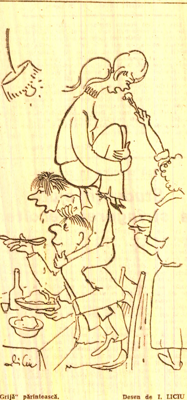
„Grijă” părintească. Desen de I. LICIU