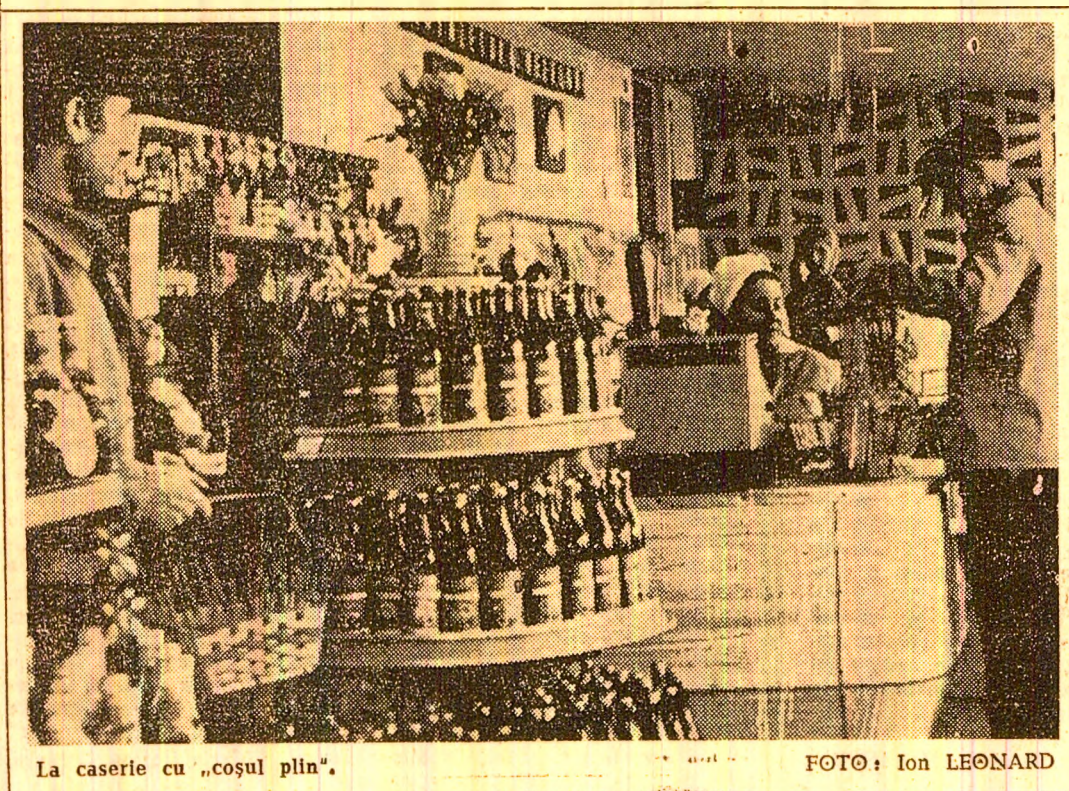
La caseriu cu „coșul plin”.

Este știut faptul că, printre obiectivele importante, puse în fața organelor administrative de stat, în acest cîmp al emulăției creatoare și efervescente generale în care oamenii muncii sînt angajați plenar pentru înlăptuirea exemplară a sarcinilor ce le revin, se numără și acela al continuării modernizării a rețelei comerciale. Secretarul general al partidului, tovarășul Nicolae Ceaușescu, ne adresa, nu demult, îndemnul de a face din acești ani de muncă rodnică pe calea împlinirii noastre multilaterale, ani al modernizării în absolut toate domeniile, al creșterii calitative generale a întregii ac-