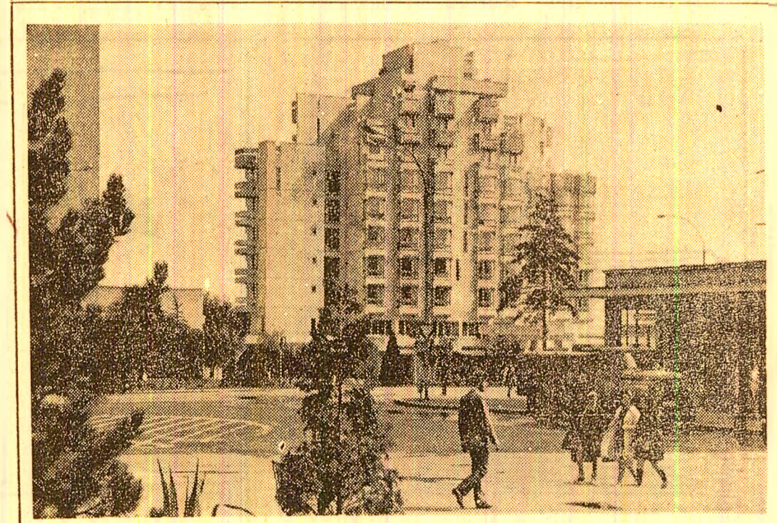
Pe noua hartă a municipiului Deva a fost ridicată o construcție impunătoare — complexul hotelier „Sarmis” — care aduce un plus de prospețime și frumusețe orașului.