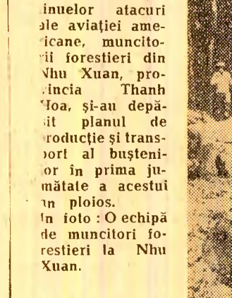
R.D. Vietnam. — În cluda continutelor atacurilor aviației americane, muncitorii forestieri din Xuan, provincia Thanh Hoa, și-au depășit planul de producție și transport în prima jumătate a acestui an ploios.