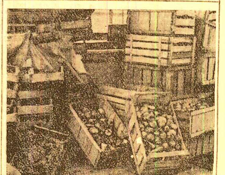
Produce ale agrocooperului în piața habelor, în stare jalnică de depreciere și... ale nimănui (!)

În metodologia predării istoriei, excursiile și vizitele au valoarea unor lecții cu caracter evocator, împlinind cunoștințele noi cu participarea efectivă. Acest fapt l-au avut în vedere cadrele didactice de la Școala generală nr. 1 din Lupeni cînd, duminică, au vizitat Muzeul mineralurgic din Petroșani, sinteză a istoriei minierii și luptei revoluționare a minerilor din Valea Jiului. Apoi, pionierii și școlarii au făcut o frumoasă și instructivă excursie în Sarmizegetusa.