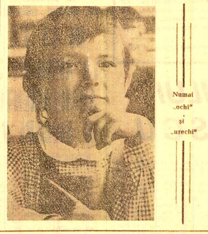
Numai „ochi” și „urechi”