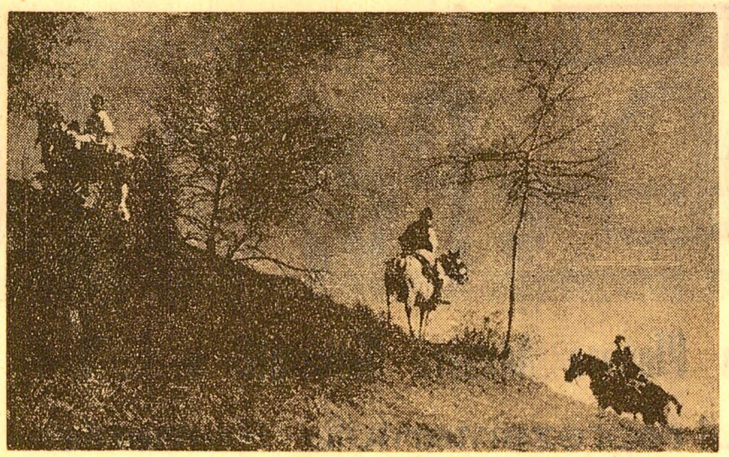
Sus pe coama dealului...