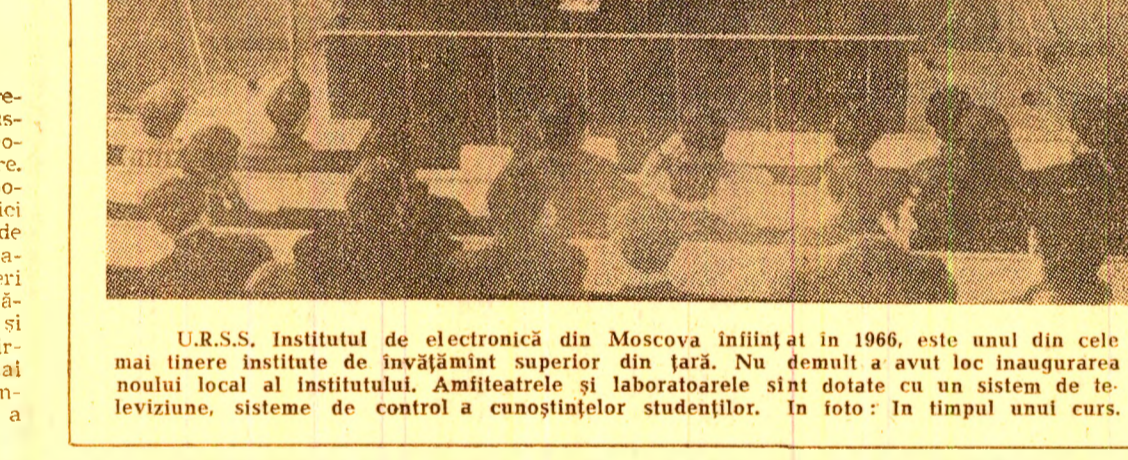
U.R.S.S. Institutul de electronică din Moscova înființat în 1966, este unul din cele mai tinere institute de învățămînt superior din țară. Nu demult a avut loc inaugurarea noii sale localități. Amfiteatrele și laboratoarele sînt dotate cu un sistem de televiziune, sisteme de control a cunoștințelor studenților. În foto: În timpul unui curs.

relor din diferite porturi grecești a trebuit să fie suspendată, datorită forței neobișnuite a vîntului pe mare. În Epir, termometrul a coborît la 6 grade sub zero. Nici Franța nu a fost ocrotită de valul de frig. Polonii și ceaușii și-au făcut apariția vineri în cea mai mare parte a țării, provocînd dificultăți și uneori chiar pericole în circulația pe șosele. Cele mai scăzute temperaturi s-au înregistrat în zona estică a Franței, în Munții Vosgi.