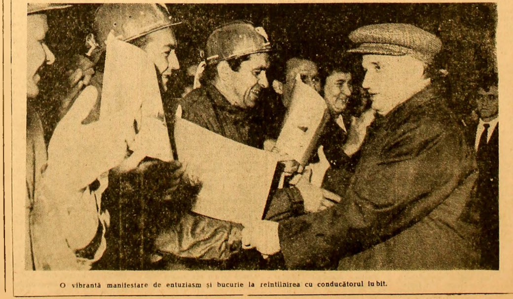
O vibrantă manifestare de entuziasm și bucurie la reîntîlnirea cu conducătorul iubit.

În prezența tovarășului Nicolae Ceaușescu, secretarul general al partidului, într-o atmosferă de vibrant entuziasm și puternică angajare în împlinirea programului de lămurire a societății socialiste multilaterale dezvoltate, au avut loc, la 25 ianuarie, în sala Ateneului Român, lucrările Conferinței organizației municipale București a P. C. R.