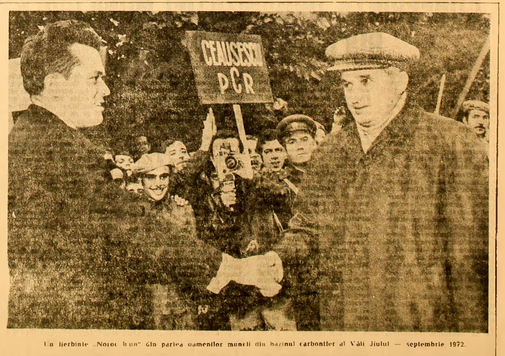
Un lierbinte „Noroc bun” din partea oamenilor muncii din bazinul carbonifer al Văii Jiului — septembrie 1972.