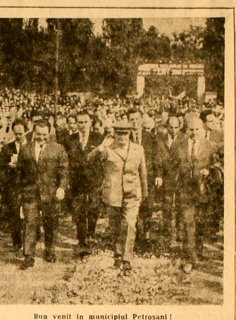
Bun venit în municipiul Petroșani!