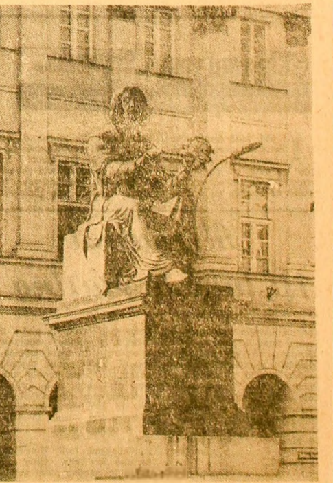
Monumentul lui Copernic, instalat în fața Academiei Polonoaee de Științe, din Varșovia.