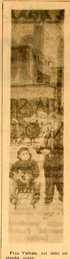
Prin Vulcan, cei mici pe strada mare