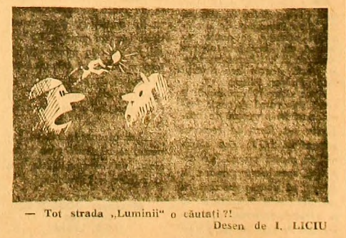
— Tot strada „Luminii” o căutați?! Desen de I. LICIU