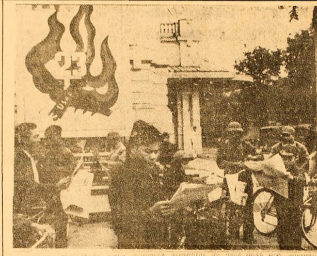
R.D. VIETNAM După semnarea acordului de pace între R.D. Vietnam și S.U.A., viața la Hanoi și împrejurimi devine liniștită. Fiecare se pregătește pentru refacerea țării distrusă de război.

VIETNAMUL DE SUD 3 (Agerpres). — Ministerul Afacerilor Externe al Republicii Vietnamului de Sud a dat publicității o declarație de protest în legătură cu operațiunile militare lansate de forțele Administrative de la Saigon împotriva zonelor controlate de Guvernul Revoluționar Provizoriu după intrarea în vigoare a Acordului privind încetarea războiului și restabilirea păcii în Vietnam.