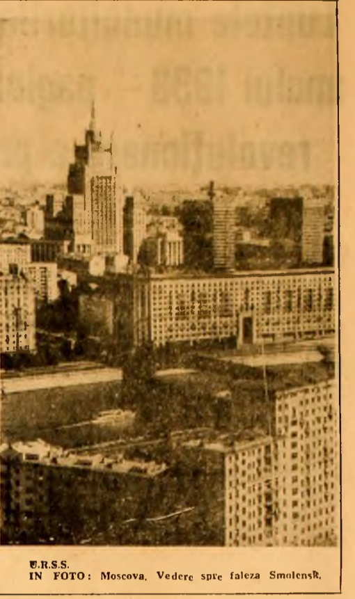
U.R.S.S. IN FOTO: Moscova. Vedere spre faleza Smolensk.

MOSCOVA 3 (Agerpres). — La 3 februarie, în Uniunea Sovietică a fost lansat „Molnia-1”, un nou satelit, destinat asigurării retransmiterii la mare distanță a programelor de televiziune și mesajelor radio-telegrafice. Agenția TASS precizează că aparatele de la bordul satelitului funcționează normal.