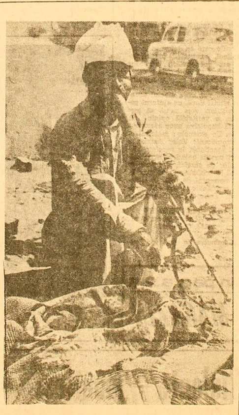
INDIA. IN FOTO: Un imblînzitor de serpi cîntînd unui șarpe veninos pe una din străzile din Delhi.

Sînt interesante și impresiile celor care efectuează aceste misiuni, mai puțin obișnuite, de menținere a ordinii. Recent, doi poliști relatează cum au „supravegheat, o noapte întreagă, cartierul Coney Island, travestii în femei: „nimic nu a înregistrat să ne fure gențile, dar ni s-au făcut numeroase propuneri „ocante”.