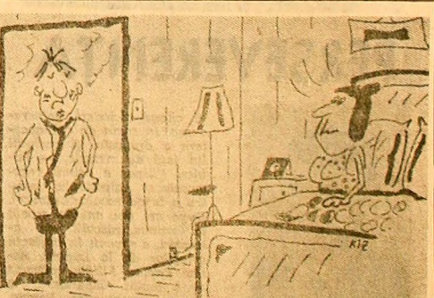
— Nu vîd de ce te impacientezi, draga mea. Au fost atîtea candidați pentru postul de secretar încît pur și simplu am fost nevoit să fac ore suplimentare de audiență!...

CRONICĂ RIMATĂ Eu, din cea mai fragedă punci, eram foarte competent în sport. De-ala astăzi trag — precum se știe — fix, la țintă! (Nu-ștă greși nici morți). Pe atunci învîngam cu placă-ngeamuri. Nici o lovitură u-am ratat; Mai țiriu, cu praștia, prin ramuri. Și-o dexteritate mi-am format. Peste ani, cînd m-am făcut mai mare. — Vînd să verii că „cel mai tare” țintă mi-a fost seful „cel mai tare” și de-atunci, sînt... carierist. Titlul nu mi-e dat din competență. Ba din contră, acum mi s-a surlat în bogata mea experiență! Prea ades, am fost „verificat”. De exemplu: cînd, cu „supărare” Pleacă vreunul — nu știu cum să spu — Dintr-o funcție puțin mai mare. Ținta mea, devine... locul lui. O să ziceți „ce absurditate”. Să vineți un „lemin” — oricît de sus. Dar succesele-mi sînt garantate; Scaunul, și vreo cîntă sute-n plus. Vinător — fără pereche, încă. Numal cu „efectul” mă împun. Prima — de-ar fi chiar în viri de stîncă — Dintr-o „levitură” mi-o supun. N-am greșit în nici-o-mprejurare. Ștîlul meu e elastic și corect. Nu, nu e doar simpla întâmplare. Dacă trag „din plîm” în... „subiect”. „Sportul” „știa, deci, mi-a dat prestația; Mîna sigură în tot ce fac. Mi-a crescut cîm en în „substanța” — „Trag” cu o mîna și cu alta-nsăc. Eu, din cea mai fragedă punci, sînt considerat „maestru-n sport”. Trag la „țintă”, orice-ar fi să fie; Arma mea ramine un... „suport”. BATRINUL