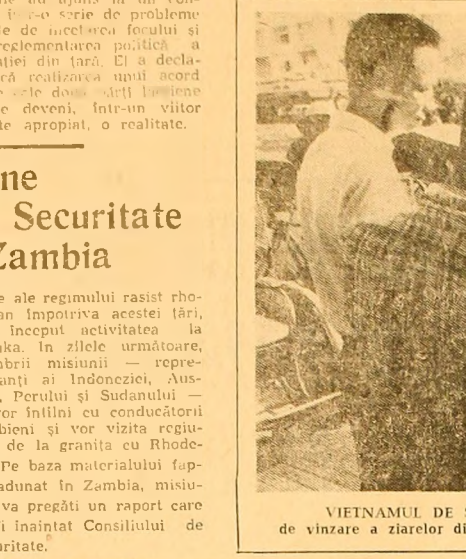
VIETNAMUL DE SUD. Ultimele stiri se citesc cu nerăbdare chiar lângă standurile de vânzare a ziarelor dintr-un punct al Saigonului.

VIENTIANE 13 (Agerpres). — Marți a avut loc cea de-a 13-a ședință a convorbirilor dintre delegațiile forțelor patriotice laotiene și părții de la Vientiane, consacrate reglementării pașnice a problemei laotiene. Tulad cuvântul în fața ziariştilor la încheierea ședinței, reprezentantul Frontului Patriotic Laotian a relevat că părțile au ajuns la un consens în ceea ce privește problemele deosebite de focalizare și de reglementare politică a situației din țară. El a declarat că realizarea unui acord între cele două părți laotiene poate deveni, într-un viitor foarte apropiat, o realitate.