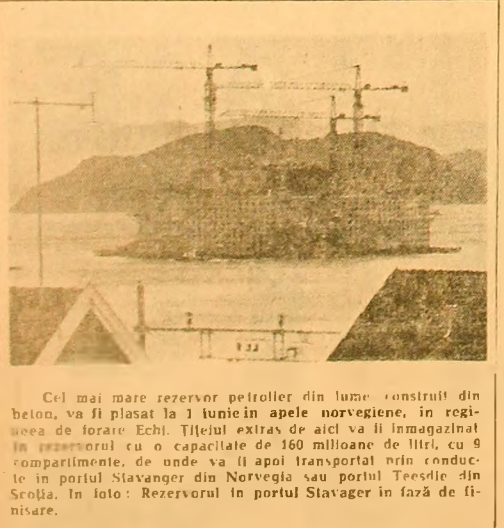
Cel mai mare rezervor petrolifer din lume, construit din beton, va fi plasat la 1 tunie în apele norvegiene, în regiunea de forare Echl. Titeul extras de aici va fi immagazinat în rezervorul cu o capacitate de 160 milioane de litri, cu 9 compartimente, de unde va fi apoi transportat prin conducte în portul Stavanger din Norvegia sau portul Teeside din Scoția. În loto: Rezervorul în portul Stavanger în fază de finalizare.