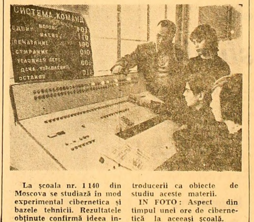
La școala nr. 1140 din Moscova se studiază în mod experimental cibernetica și bazele tehnicii. Rezultatele obținute confirmă ideea introducerii ca obiecte de studiu aceste materii.