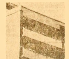
Orizontală din beton pe verticală