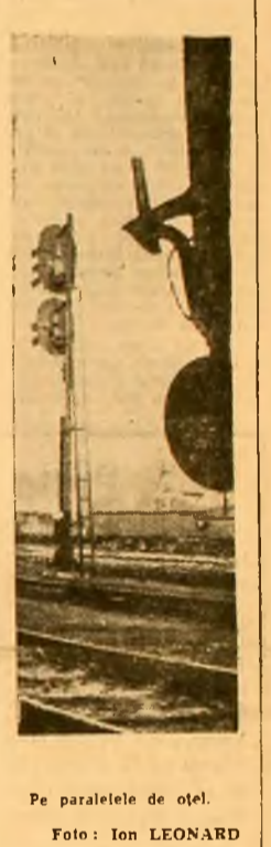
Pe paralelele de țel.