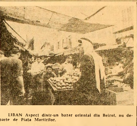
LIBAN Aspect dintr-un bazar orientat din Beirut, nu departe de Piața Maritilor.

trebuie să guverneze relațiile între toate statele participante la conferință, măsurile concrete pentru transparența în fapt a acestor principii și, în sfîrșit, acțiunile pe linia dezarmării militare și dezarmării, ca parte integrantă a edificării unui sistem trainic de securitate pe continentul nostru.