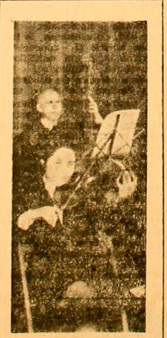
Orchestra semisimfonică a Casei de cultură din Petroșani și-a câștigat de cîțiva ani un binemeritat prestigiu în rîndul publicului meloman din Valea Jiului. Revitalizarea activității acestei formații muzicale este așteptată cu vîlvă așterea. În acest aspect din timpul unei recente repetiții.