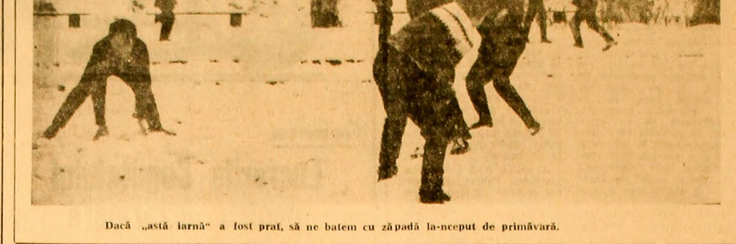
„Dacă „astă iarnă” a fost praf, să ne batem cu zăpadă la-nceput de primăvară.”

...Celor care încă mai caută borcane și nu găsesc în rețeaua comercială. Pentru că, se pare, serviciul comercial al I.C.R.M. de mai multe luni, nu are unde să depoziteze acest „stoc” de borcane. (Adresa: depozitul din strada din spatele garii).”