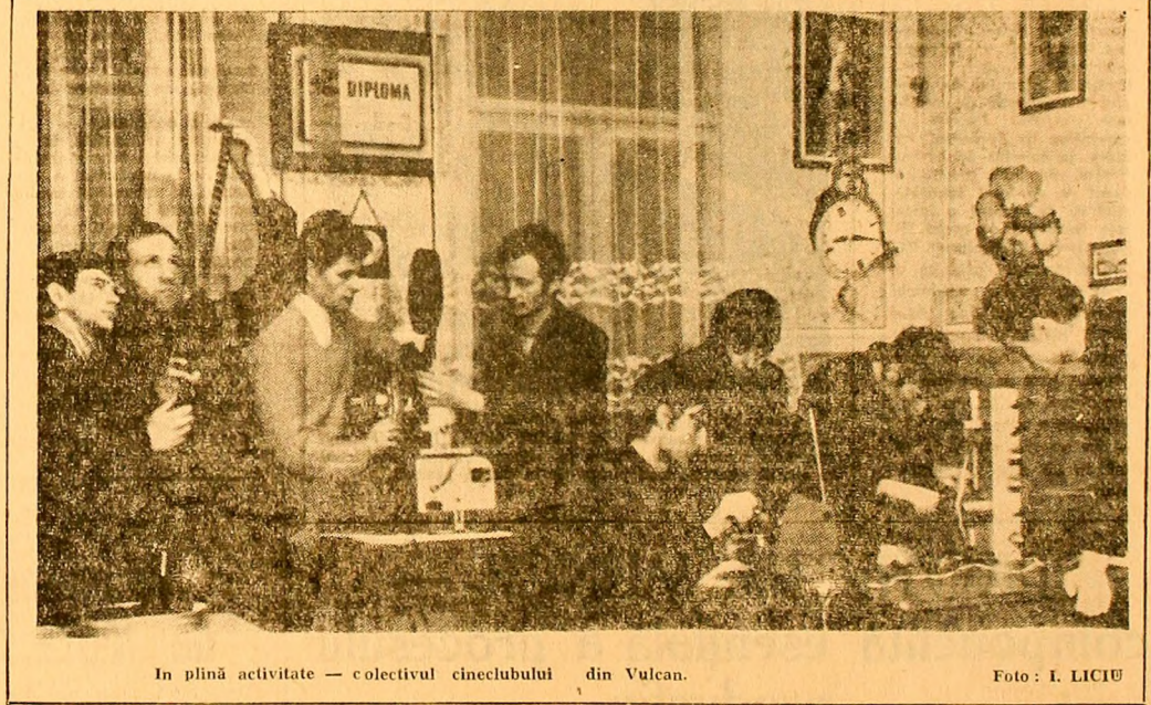
În plină activitate — colectivul clubului din Vulcan.