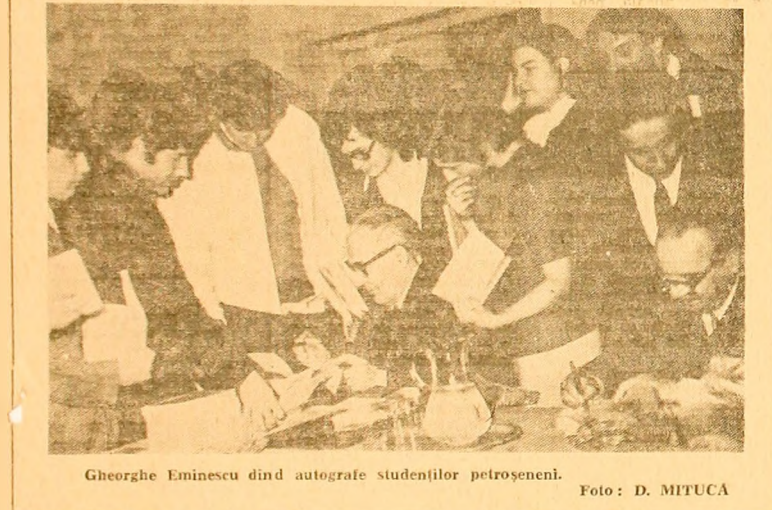
George Eminescu dind autografe studenților petroșeni.

De asemenea, este important să se asigure că toate plățile sunt făcute la timp și în funcție de normele stabilite. Aceasta va contribui la creșterea motivației și a productivității muncii.