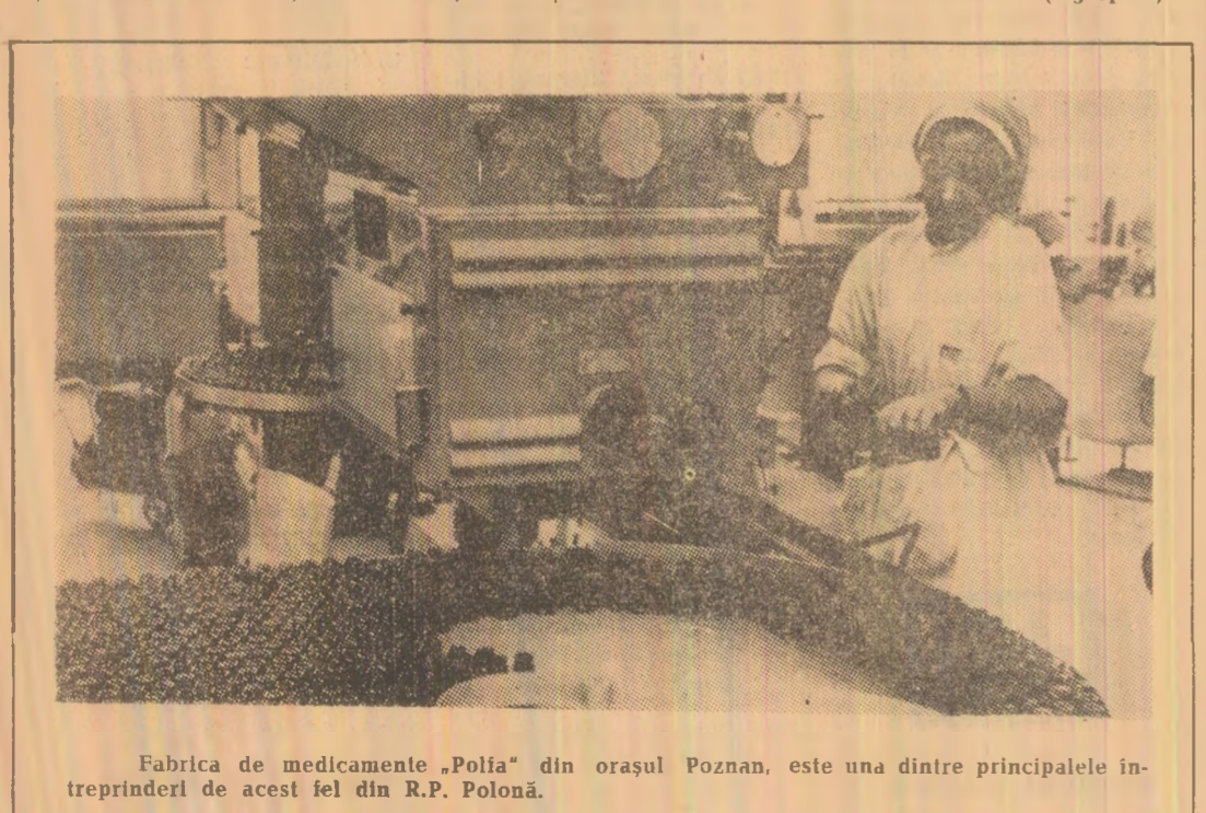
Fabrica de medicamente „Polia” din orașul Poznan, este una dintre principalele întreprinderi de acest fel din R.P. Polonă.