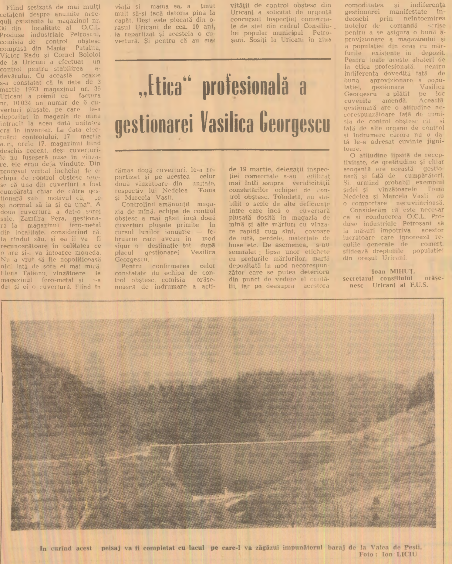
In curînd acest peisaj va fi completat cu lacul pe care-l va zăgăzui impunătorul baraj de la Valea de Pești.