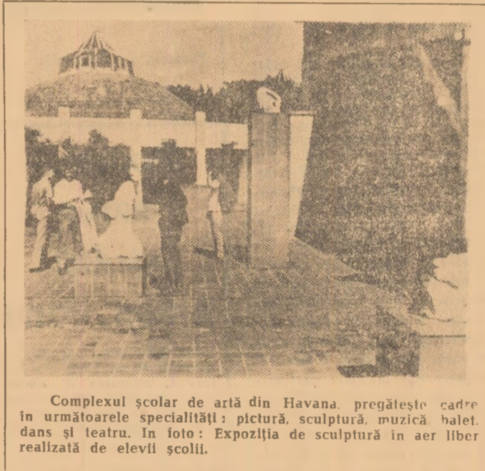
Complexul școlar de artă din Havana, prețeste cadre în următoarele specialități: pictură, sculptură, muzică, dans și teatru. În foto: Expoziția de sculptură în aer liber realizată de elevii școlii.

CAIRO 3 (Agerpres). — Președintele R.A., Egipt, Anwar Sadat, care a efectuat o vizită de o zi în Libia — a încheiat, marți, în capitala egipteană — informează agenția M.E.N. În cursul vizitei la Tripoli, Anwar Sadat a avut convorbiri cu președintele Consiliului Comandamentului Revoluției Moamer El Gaddafi, și cu alte oficialități libiene. Privind relațiilor agenților de presă, discuțiile purtate de cele două părți s-au concentrat asupra unor aspecte privind realizarea proiectului de uniune dintre R.A., Egipt și Libia, precum și evoluția situației din Orientul Apropiat.