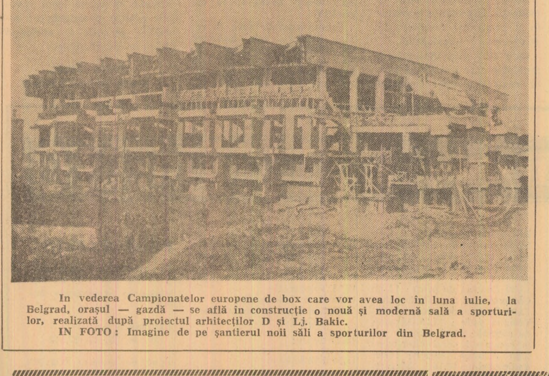
În vederea Campionatelor europene de box care vor avea loc în luna iulie...