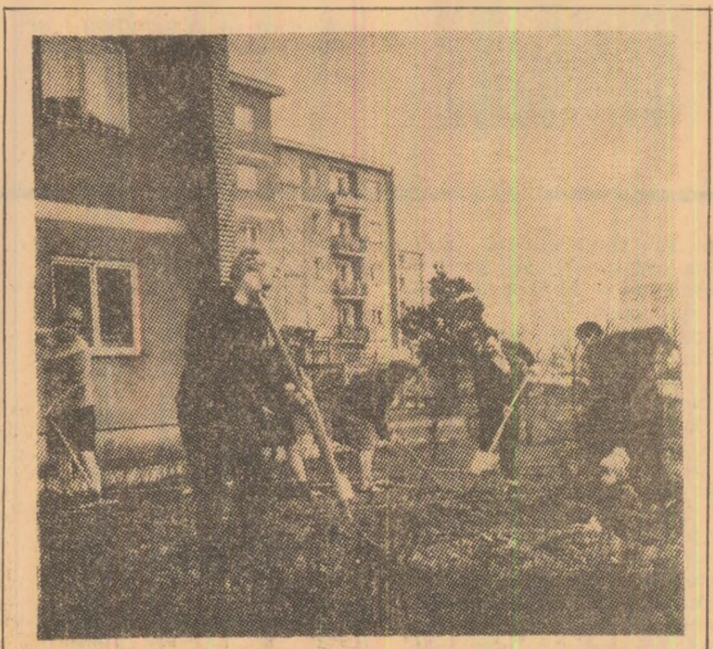
Locatarii blocului nr. 3 de pe strada Independenței din cartierul Aeroport — Petroșani au ieșit la amenajarea spațiului verde...

tat că relațiile economice dintre cele două țări se dezvoltă cu succes, că există noi posibilități pentru a extinde în continuare colaborarea și cooperarea economică. În acest sens s-a convenit ca instituțiile de planificare să sprijine organele de comerț exterior din cele două țări pentru majorarea volumului livrărilor reciproce de mărfuri din anii 1974-1975 peste prevederile Acordului de lungă durată și, de asemenea, acțiunile de cooperare industrială și tehnico-științifică. Convorbirile s-au desfășurat într-un spirit de cordialitate și înțelegere deplină. (Agerpres)