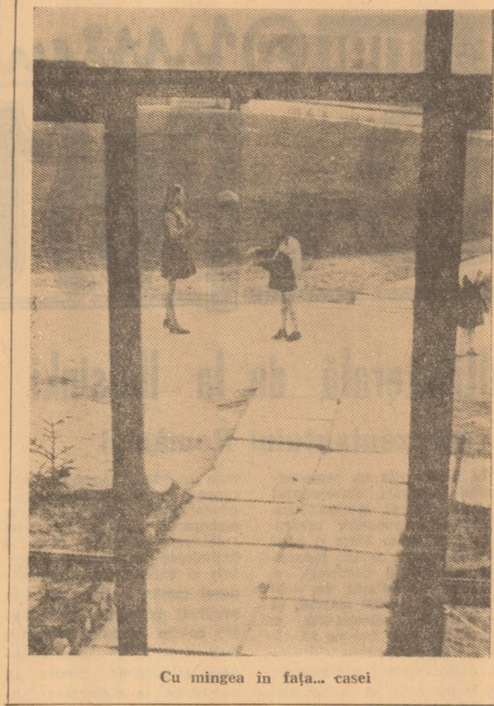
Cu mingea în fața... casei