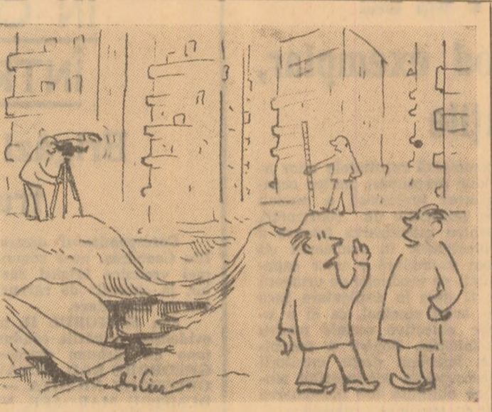
— Ce, a venit televiziunea? — As! Fac măsurători pentru o punte peste groapă că li-e mai ușor să facă pod decît s-o astupe...

În fiecare ora șera sectorului din Lupeni al I.G.C. asigură în cea mai mare parte florile