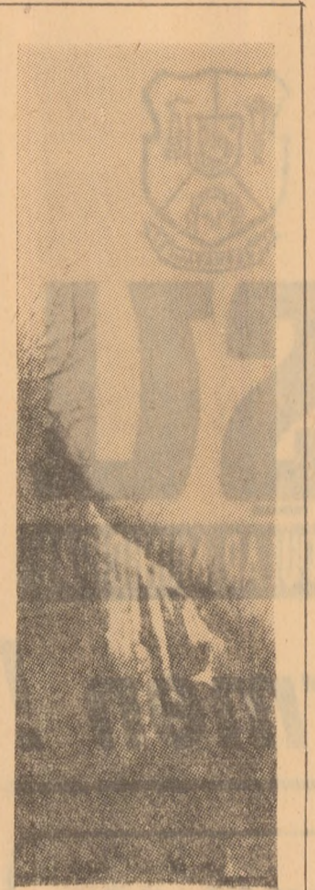
Rămășițe ale lemnii pe drumul ce urcă spre cabana forestieră Bilgu.

Ch. ROMAN, șeful serviciului administrației locale de stat