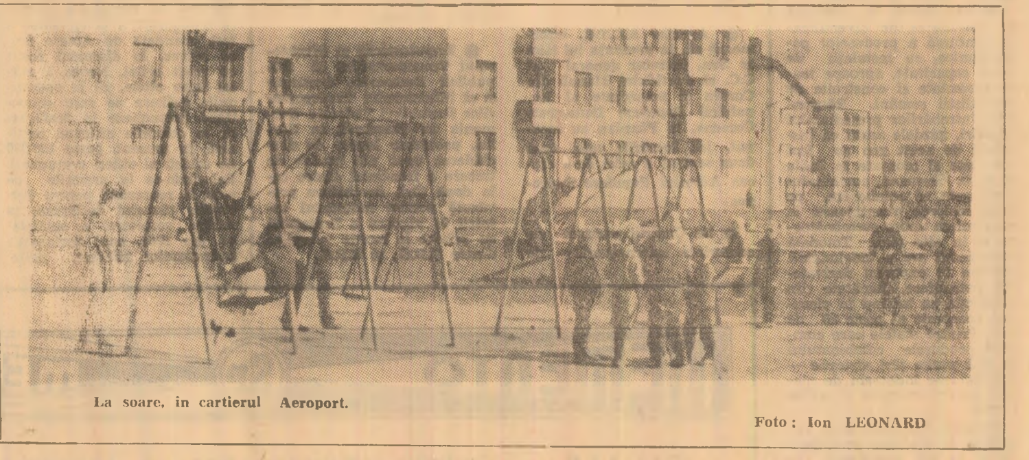
La soare, in cartierul Aeroport.