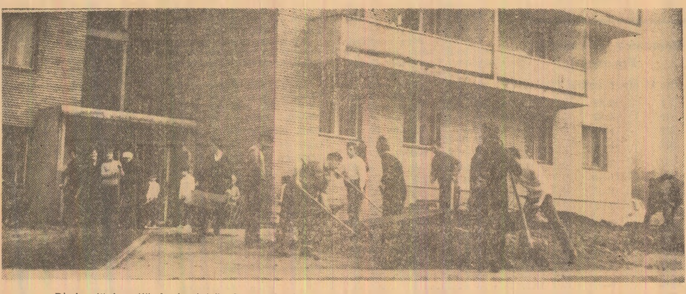
Dimineață însorită de duminică. O zi splendidă, care a lămbiat pe aproape toți locatarii blocului 109 de pe strada Republicii din Petroșani să participe la lucrările de infumusetare a împrejurimilor „turnului“.

În săptămîina ce a trecut în toate localitățile municipiului au continuat, în ritm crescînd, acțiunile de muncă patriotică avînd drept scop finalizarea obiectivelor din planul de salubritate generală și infumusetare. A continuat reamenajarea și extinderea zonelor verzi îndeosebi în cartierul nou, plantările de arbori și arbuști ornamentali, s-au săpat rondurile de flori, s-au reparat străzi, trotuare, poduri și podete. Valoarea lucrărilor edililor-gospodărești, de curățenie și infumusetare realizate în săptămîina 2-8 aprilie de cetățeni prin muncă voluntar-patriotică însumează o valoare de peste 4.400.000 lei. În zilele ce urmează, fără a neglija cartierul și străzile mai vechi ale localităților, forțele și eforturile cetățenilor, ale sectoarelor prestatoare de servicii, instituțiilor și unităților economice vor trebui concentrate în continuare în marile cartiere cum sînt Aeroport și Carpați — Petroșani, 8 Martie și 7 Noiembrie — Petrelea, Braia și Viscoza — Lupeni, în părțile noi ale orașelor Vulcan și Uricani. Atenția principală va fi orientată spre nivelarea terenurilor, săparea și însămînțarea noilor zone verzi, a cărărilor de cu-