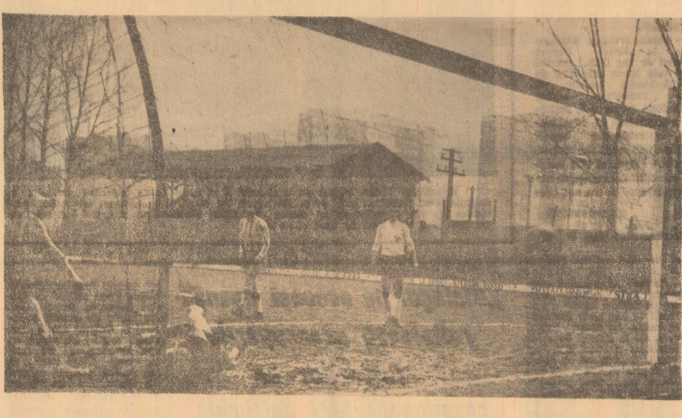
Minutul 3: Voicu deschide „supapa” golurilor, la Lupeni...