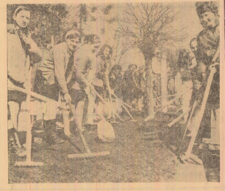
Elevii Școlii comerciale din Petroșani, la acțiunea de primăvară.