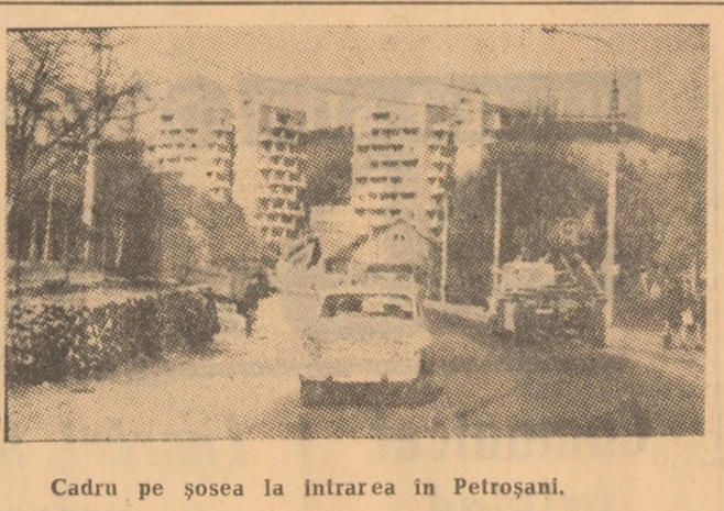
Cadru pe șosea la intrarea în Petroșani.