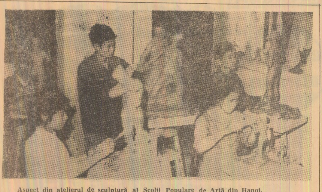
Aspect din atelierul de sculptură al Școlii Populare de Artă din Hanoi.

PARIS (Agerpres). — Construcția autostrăzii inelare din jurul Parisului, lucrare înălțată în urmă cu 17 ani, s-a încheiat, după cum informează A.F.P. Avînd o lungime de 35.500 km, autostrada inelară cu 41 de intersecții nivelate a costat aproximativ 2 miliarde de franci.