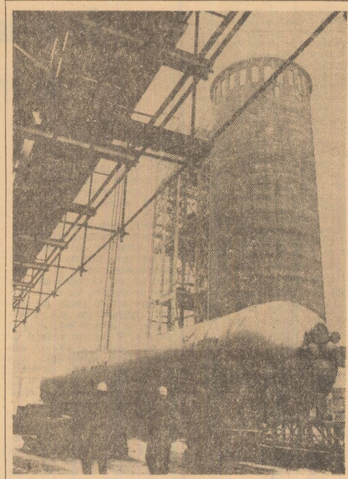
R. D. GERMANIA: În foto: Reactor pentru carbamid cu o înălțime de 36 m, gata pentru asamblare la noua uzină de nitrogen de la Piestaritz.

Intr-o declarație făcută presei, cancelarul, după ce și-a exprimat satisfacția pentru că