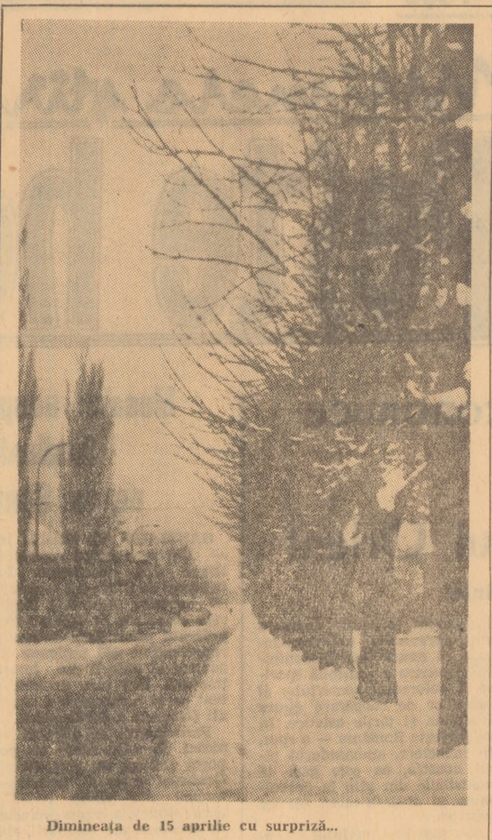
Dimineața de 15 aprilie cu surpriză...