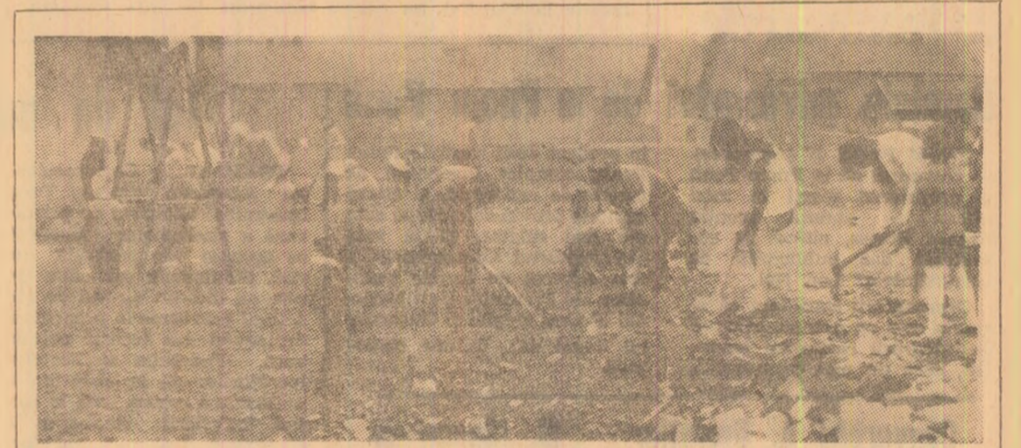
În aceste zile, ale toaletei de primăvară, alături de cei mari și cei mai mici cetățeni participă la înfrumusețarea cartierelor noastre.