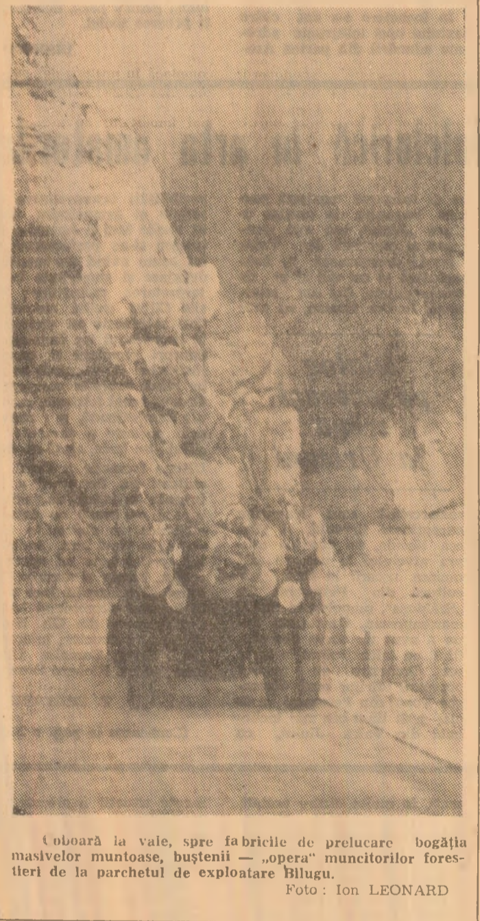
Un obiect al vaze, spre fabricile de prelucrare bogăția masivelor muntoase, bustenii — opera muncitorilor forestieri de la parchetul de exploatare Bilgu.