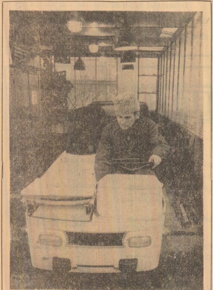
La Institutul de cercetări pentru energie electrică din Budapesta, s-a fost realizată câteva tipuri de automobile electrice.

Luînd cuvîntul după adoptarea rezoluției, reprezentantul român, Mircea Petrescu, ministrul consilier la misiunea permanentă a României din Geneva, a scos în evidență necesitatea extinderii sistemului generalizat de preferințe asupra tuturor țărilor în curs de dezvoltare, indiferent de sistemul lor social-economic sau zona geografică din care fac parte.