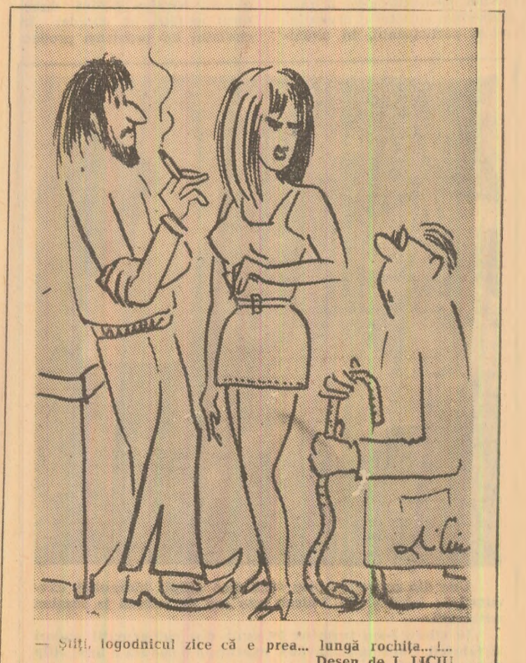
— Șiți, logodnicul zice că e prea... lungă rochia... Desen de I. LICIU