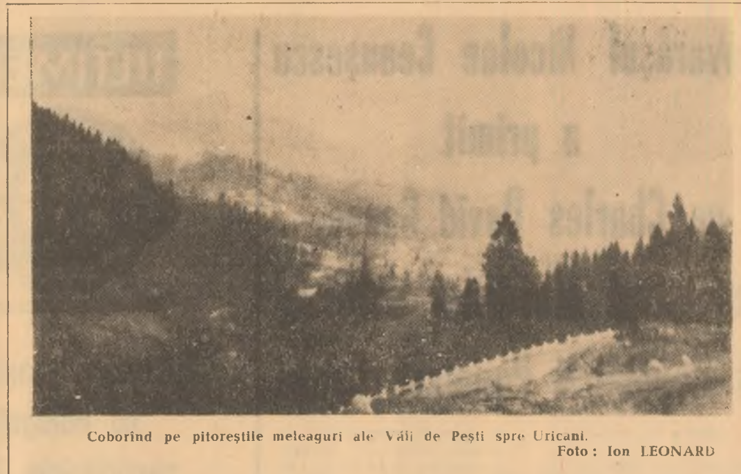
Coborînd pe pitoreștile meleaguri ale Văii de Pești spre Uricani.

constatărilor făcute de controlul obștești dar acum menționăm doar hotărîrea echipei respective: în curînd va reveni pe de aceste cantine pentru a vedea măsurile ce s-au luat, în urma recomandărilor făcute. Va fi un moment de confruntare a seriozității administratorilor de cantine cu cerințele îmbunătățirii continue a activității lor, de ridicare pe trepte noi a servirii abonaților cu mîncăruri gustoase, alcătuite pe baza unor meniuri raționale, ținînd cont de gusturile și cerințele oamenilor. Și mai ceva: consistența mîncării să fie dublată de o tot atît de consistentă curățenie, igienă, de servirea civilizată a abonaților. Vom vedea la noua vizită ce s-a făcut în această direcție.