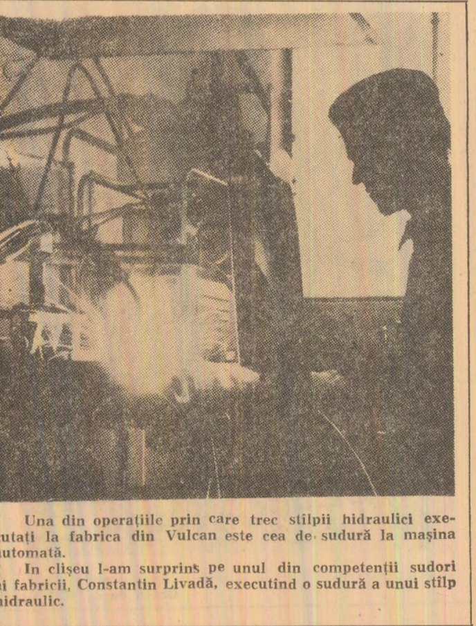
Una din operațiile prin care trec stîlpii hidraulici executați la fabrica din Vulcan este cea de sudură la mașina automată.