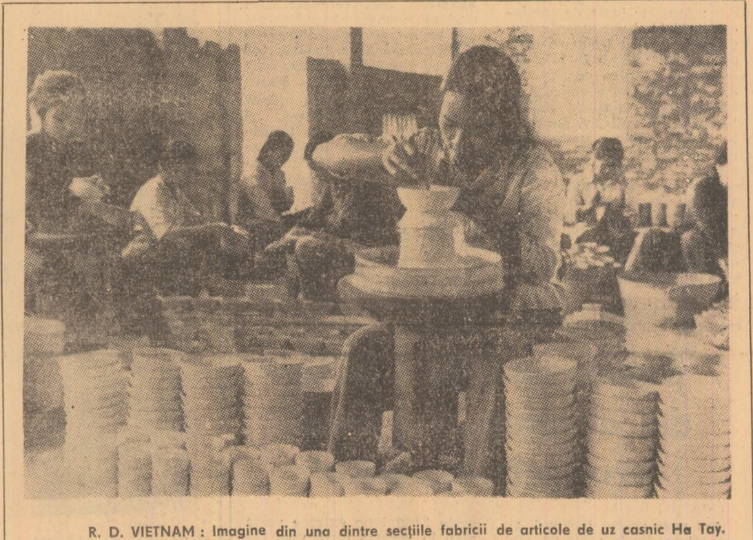
R. D. VIETNAM: Imagine din una dintre secțiile fabricii de articole de uz casnic Ha Tay.

desi au îndeplinit prevederile unor articole ale acordului au violat, în repetate rânduri, multe dintre acestea. Astfel, administrația de la Saigon lansează acțiuni militare împotriva zonelor controlate de G.R.P. iar, recent, trupele lor au pătruns în Cambodgia. De asemenea, autoritățile saigoneze întreprind acțiuni represive și de teroare împotriva populației din zonele pe care le controlează și refuză să îndeplinească cerințele acordului. Nguyen Huu Tho a încheiat cuvîntarea afirmînd că guvernul S.I.A. și administrația de la Saigon,