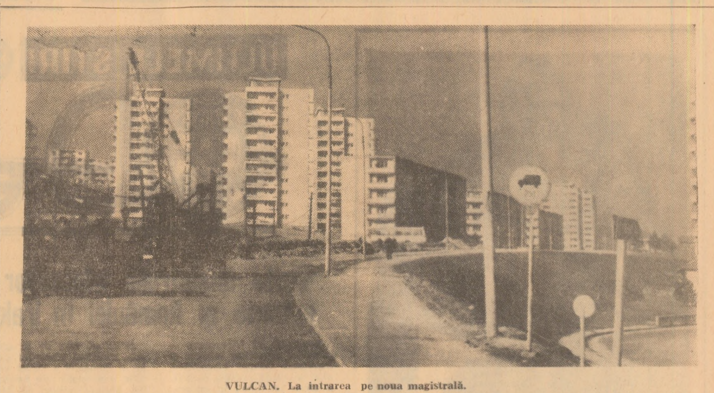
VULCAN. La intrarea pe noua magistrală.