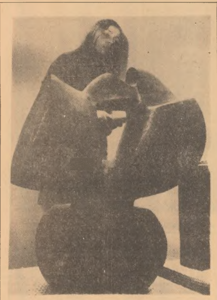
„Tapiserie românească, plastică în lemn și ceramică” este titlul expoziției deschise de curind, într-una din galeriile de artă din centrul capitalei cehoslovace. Expoziția a atras un mare număr de vizitatori dornici să cunoască realizările în acest domeniu, ale tinerilor artiști plastici din România.