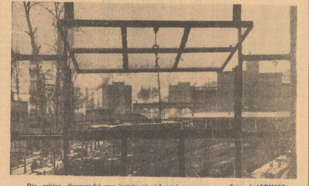
Din cabina dispecerului spre incinta minei Lupeni.