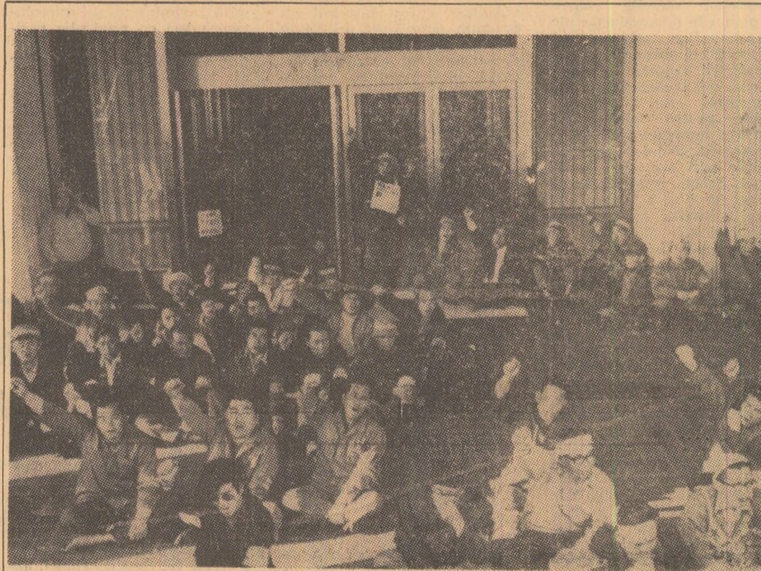
Peste 6.000 de muncitori din domeniul construcțiilor au organizat de curînd, în fața amfiteatrului „Hibiya” din Tokio, o amplă demonstrație de protest împotriva firmelor comerciale de livrare a materialelor lemnoase de construcție. Acestea, prin stocarea îndelungată a materialelor lemnoase necesare construcțiilor, obțin, prin punerea lor pe piață la prețuri exorbitante, niște profituri uriașe.

Conferința de presă a fost urmată de o vizită în standurile pavilionului românesc care acoperă aproximativ 4.500 metri pătrați, constituit din mai mare expoziție străină din cadrul Tîrgului și cea mai importantă și complexă prezentare a realizărilor românești în diverse sfere ale economiei, organizată pînă acum în Franța.