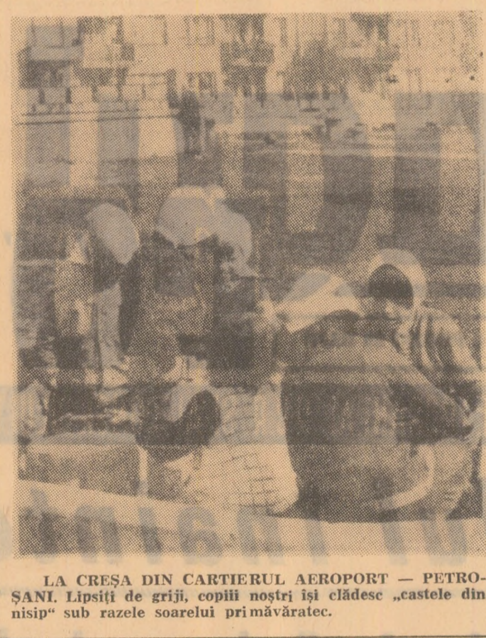
LA CREȘA DIN CARTIERUL AEROPORT — PETROȘANI. Lipșiți de griji, copiii noștri își clădesc „castele din nisip” sub razele soarelui primăvarațec.

Zăgrăvind în chip realist raporturile de clasă din societatea feudală a Țărilor românești din perioada acelor ani, Dimitrie Cantemir întâmpinează răscoala țărănilor ca o luptă pentru slobozie (libertate) și moșie (pământ), „cu cinstea a muri, decât prin multă vece necinste a trăi mai de folos și mai de laudat este”. Capodoperă literară a lui Dimitrie Cantemir, „Istoria ieroglifică”, operă cu conținut social și literar - filozofic, cu tendință satirică, introduce în domeniul