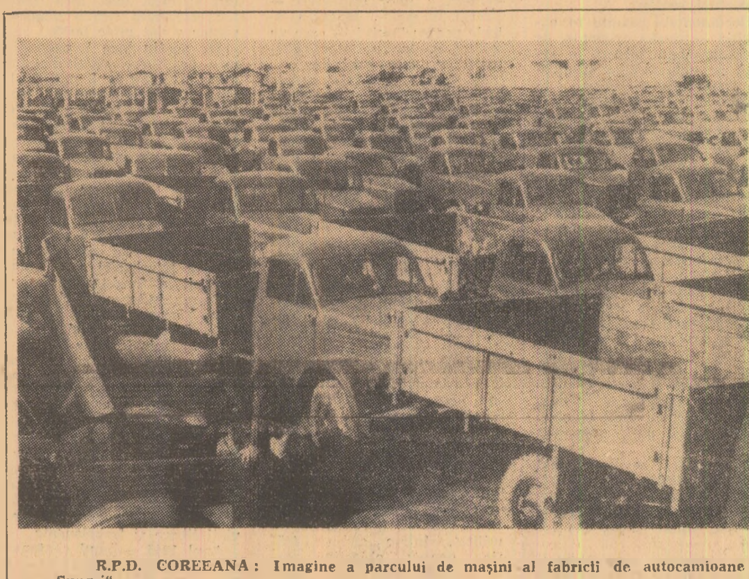
R.P.D. COREEANA: Imaginea a parcului de mașini al fabricii de autocamioane „Sungri“.

Comisia Politică a P.C.C. își exprimă încrederea că printr-o acțiune unitară, poporul chilian va reuși să înfrângă asemenea manevre. Ziua de 1 mai trebuie să devină ziua mobilizării forțelor populare împotriva acțiunilor duse la îndeplinire, se subliniază în declarație.