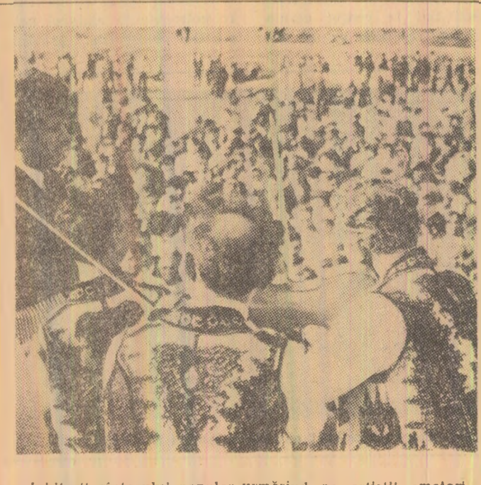
Iubitorii cîntecului popular urmînd pe artiștii amatori.