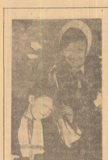
Am venit și noi la maiul.

poi, la zăpadă, unde au mai respirat o dată aerul iernii. Din vîră au cuprins cu privire întreaga Vale strălucită de crestele albe albe ale Retezului, o Vale care, prin minunatele ei locuri, a oferit în aceste zile multe clipe de odihnă pentru oameni muncii, de recreere și reconfortare în ambianța plăcută a naturii.