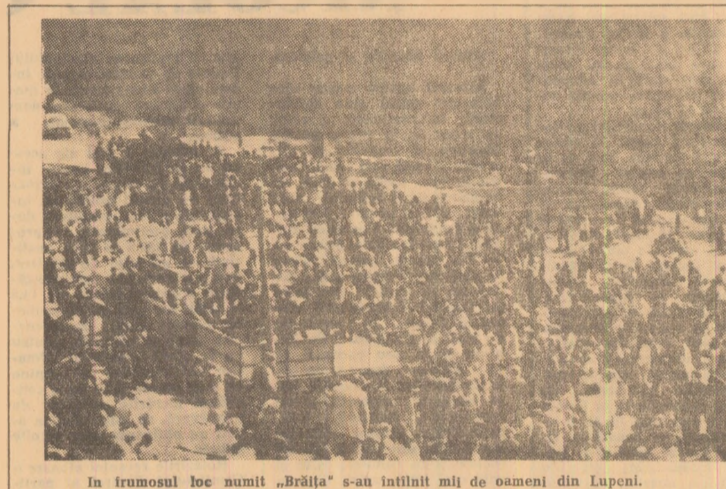
În frumosul loc numit „Brăița” s-au întîlnit mij de oameni din Lupeni.

Și, ieri a fost soare și lumină din belșug din Paring pînă-n Retez. Cit tine Valea noastră a Cărbunelui a fost tot o sărbătoare, un cîntec, joc și voie bună în care s-au prins veterani ai muncii, eroi, nevieș cu baticuri înflorate și copii cu soarele-n obraji.