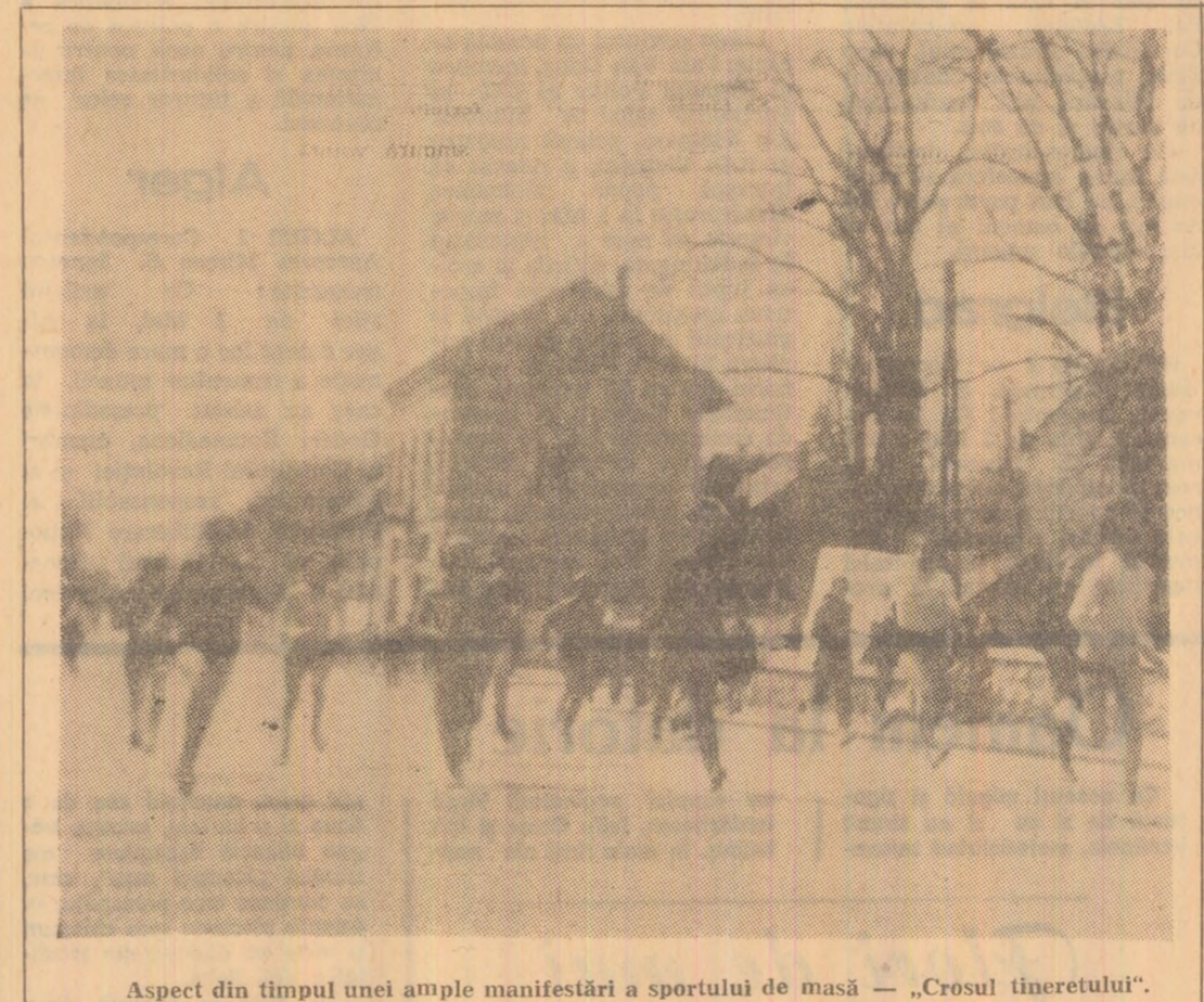
Aspect din timpul unei ample manifestări a sportului de masă - „Crosul tineretului”.

După ce, în min. 51, Briceag transformă o nouă lovitură de pedeapsă, iar în min. 52 Martin îl limitează, fixînd scorul la 10-6, oaspeții pun stăpînire pe joc, obligînd Știința să se aplece, să părăsească dintr-o dată liniștit. Timp de aproape jumătate de oră, gazdele sînt masate în fața preșriilor buturii, numărul „treccerilor” în jumătatea de teren a adversarului fiind de numai 4.