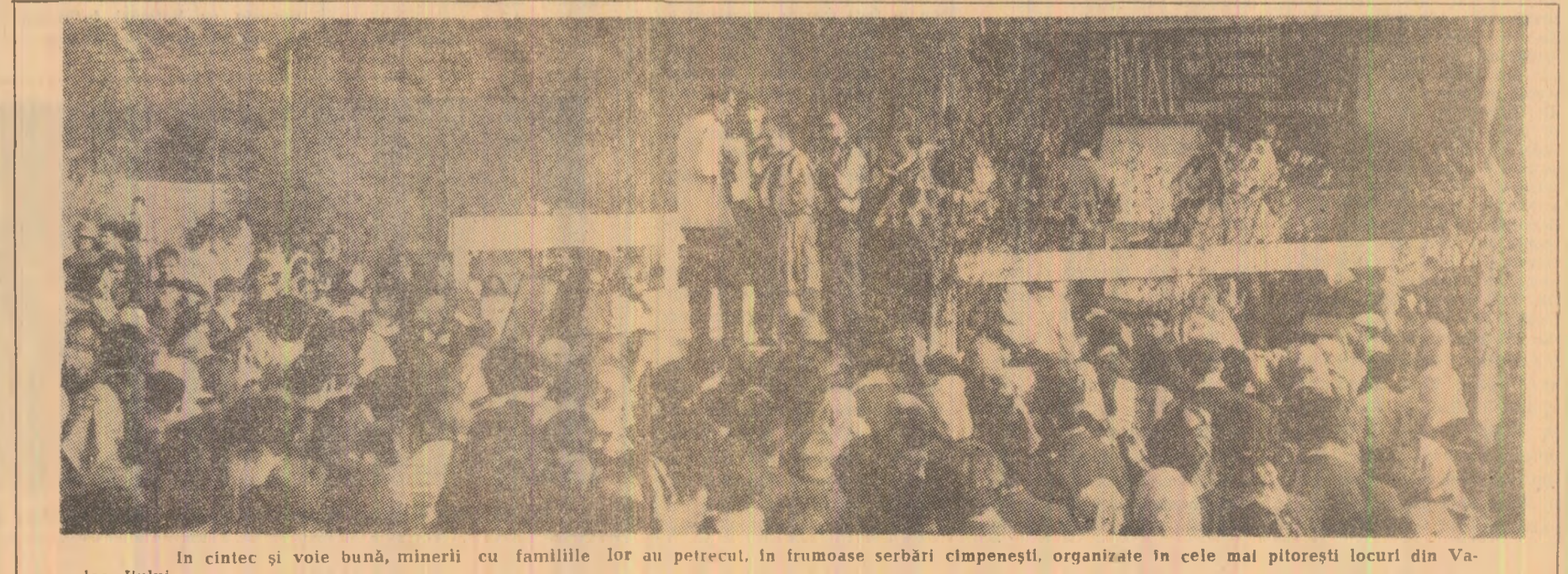
În cîntec și voie bună, minerii cu familiile lor au petrecut, în frumoase serbări cîmpenești, organizate în cele mai pitorești locuri din Valea Jiului.