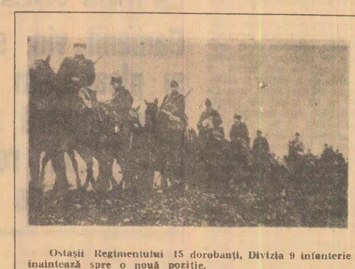
Ostașii Regimentului 15 dorobanți, Divizia 9 infanterie înaintează spre o nouă poziție.

In acea noapte am fost numit șeful grupei de parlamentari a diviziei. Dar unitățile hitleriste din fața dispozitivu-