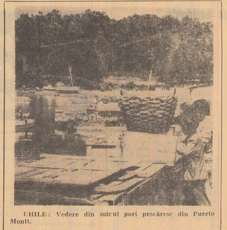
CHILE: Vedere din micul port pescăresc din Puerto Montt.

ția France Presse, forțele palestiniene au ripostat, utilizînd tunuri antiaeriane și rachete.