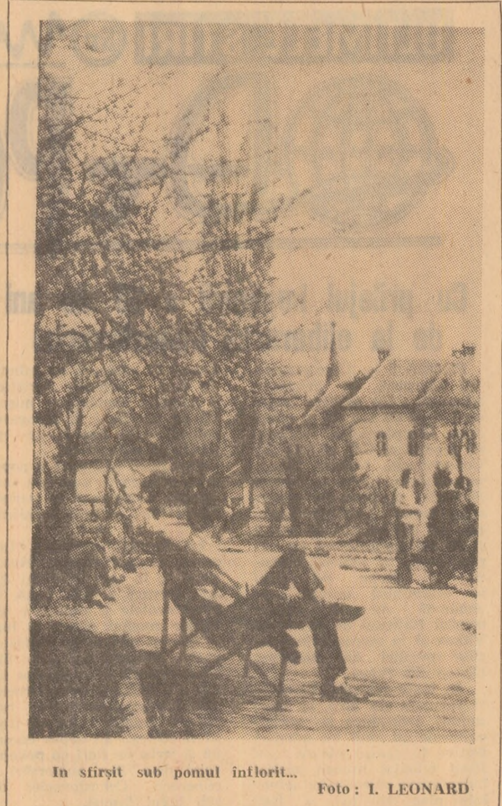
În sfîrșit sub pomul înflorit...

Uzina „Electronica” din București a pus în fabricație un nou aparat românesc: televizorul portabil tranzistorizat. Primul lot experimental de 1000 de bucăți (din producția de 10000 televizoare portabile, planificate pentru acest an) se află în fabricație urmînd ca peste pu-