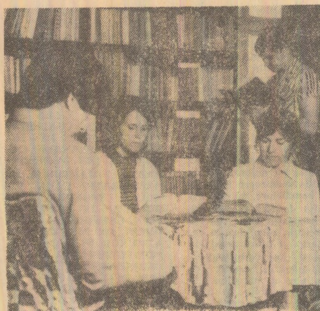
Ore de destindere în sala de lectură a bibliotecii clubului muncitoresc din Aninoasa.

Ion STOICIU secretarul comitetului U.T.C. I.U.M.P.