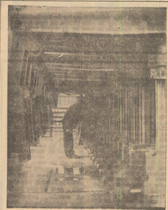
Cadre pășitoare realizate la F.S.H. Vulcan cu care va fi dotată E. M. Petrița.

informat conducerea uzinei, este vorba de ventilatorul electropneumatic de 500 Z, trolul cu scurper de 22 KW, mașina de extracție angrizitoasă cu biciclu, trolul pneumatic cu scurper, transportorul cu raclele TR-4, locomotiva electrică cu troleu, de 7 tone, și mașina de încărcat cu basculare laterală. Din acestea, șase utilaje sînt omologate în faza de prototip, iar unul — trolul cu scurper de 22 KW, se află în faza finală, urmînd a fi introdus în producție.