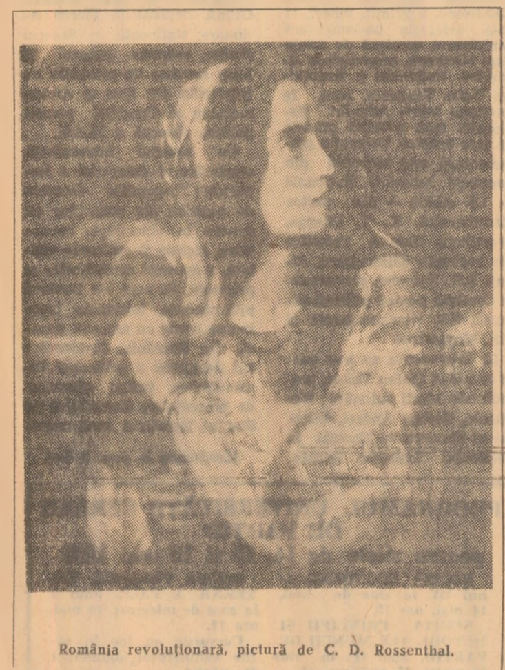
România revoluționară, pictură de C. D. Rosenthal.

La această generație impresionantă militanțismul național, patosul cătănesc, fervoarea slujirii revendicărilor politice, convingerea că arta trebuie să exprime năzuințe înalte ale societății și poporului cărora artistul le aparține. Gh. Asachi, C. Negruzzi, M. Kogălniceanu, V. Alecsandri, în Moldova, V. Carlova, G. Alexandrescu, N. Bălcescu, D. Bolintineanu, în Muntenia, T. Cipariu, Gh. Barițiu, A. Mureșan, în Transilvania au desfășurat o bogată și multilaterală activitate. Ei solidarizează o voință comună de afirmare națională, a identității naționale, patriotice ordent și mesianic. O atenție deosebită au acordat-o mișcărilor de influențare și ridicare culturală a poporului: învățămîntul în limba română, presa, teatrul, literatura originală, integrate organic în viața națională, conșinși fiind că unitatea culturală trebuie să precedă și să faciliteze independența națională și socială ca și unitatea politică a românilor.