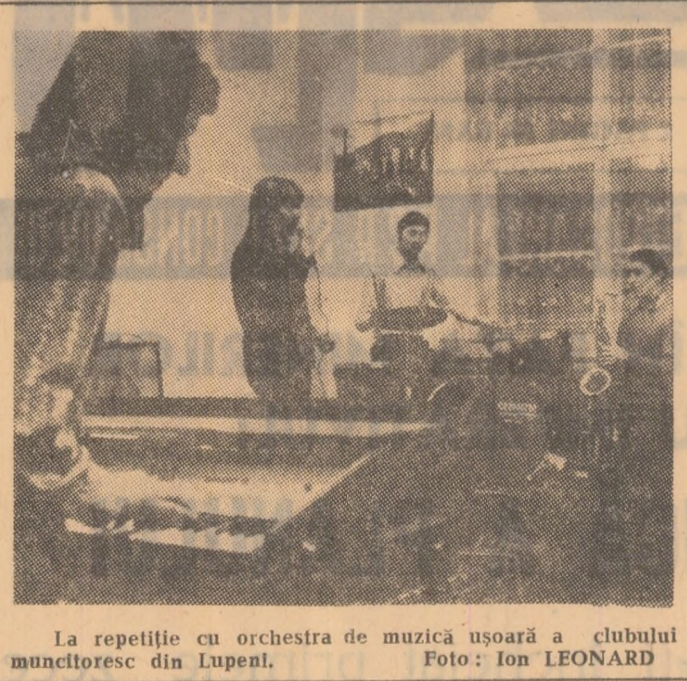
La repetiție cu orchestra de muzică ușoară a clubului muncitoresc din Lupeni.

Prof. Gheorghe ANTOCE, directorul Liceului Vulcan