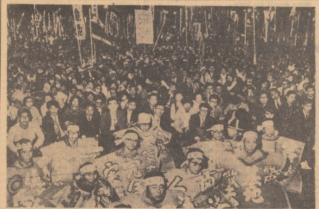
Oameni ai muncii din Tokio și din alte orașe ale Japoniei, adunați la Meiji Park; pe pancarte purtate de aceștia, se cere, între altele, revindicări sociale, și înlăturarea imediată și completă a bazei militare americane de la Yokota.

La Belgard a avut loc, vineri, cea de-a 41-a ședință a Prezidiului Uniunii Comunistilor din Iugoslavia. Cu acest prilej, Stane Dolan a fost reales în funcția de secretar al Biroului Executiv al Prezidiului U.C.I. pe perioada până la Congresul al X-lea al U.C.I.