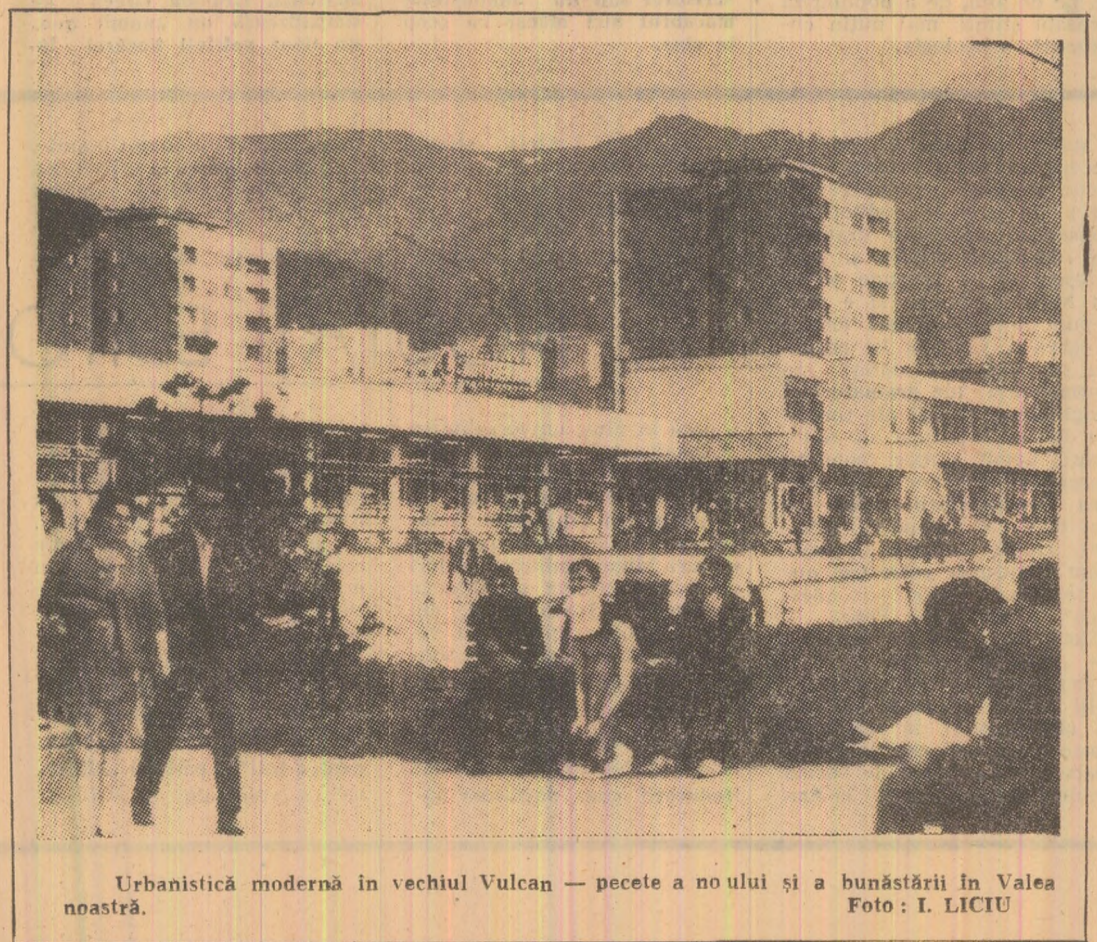
Urbanistică modernă în vechiul Vulcan — peceta a noului și a bunăstării în Valea noastră.

Prin hotărîrea a Comitetului Executiv al C.C. al P.C.R. și a Consiliului de Stat a fost aprobată componența Consiliului organizării economico-sociale, înființat prin Legea nr. 3/1973. Consiliul este format din 45 de membri, reprezentanți ai unor ministere și organe centrale, prim-secretari și secretari ai unor comitete județene de partid, conducători de centrale și întreprinderi industriale, specialiști.