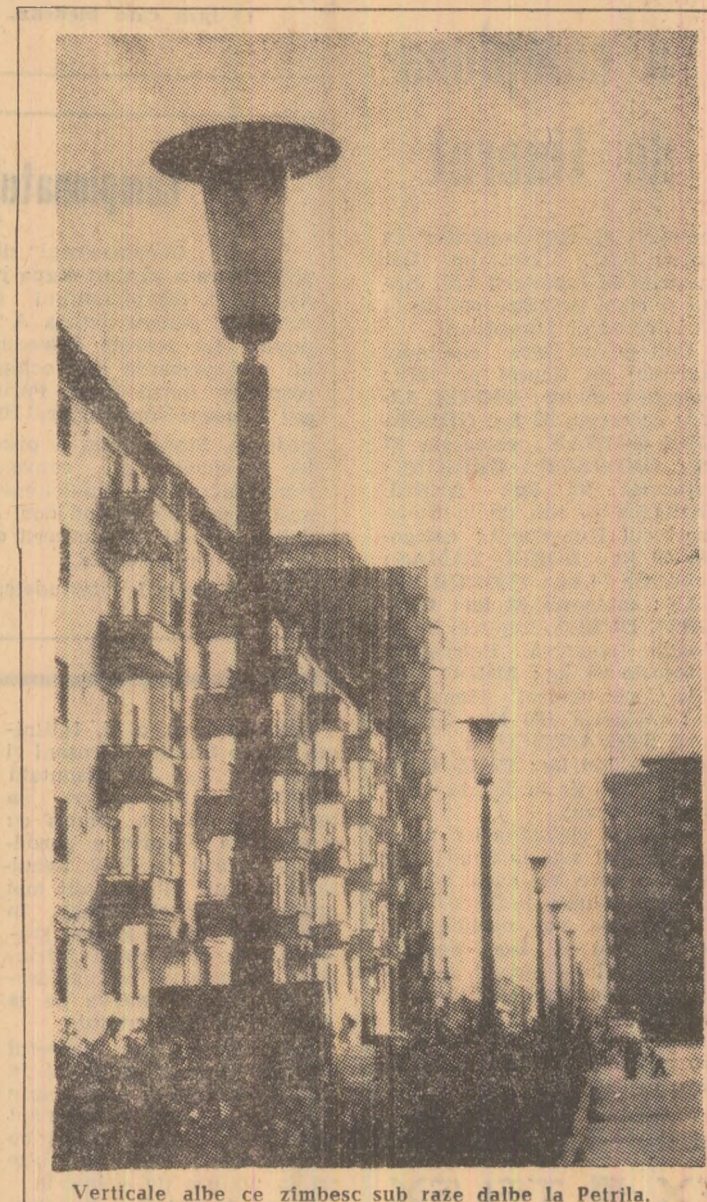
Verticale albe ce zîmbesc sub raze dalbe la Petrița.

Participarea tradițională a României la Tîrgul Internațional de la Tunis se va concretiza, la ediția actuală, care se desfășoară între 18 mai și 3 iunie, printr-o expoziție colectivă a realizărilor de vîrf din unele ramuri, dintre cele mai importante, ale economiei noastre naționale: mașini și utilaje, produse chimice și petrolifere, materiale de construcții, mărfuri agroalimentare. Alături de instalațiile și