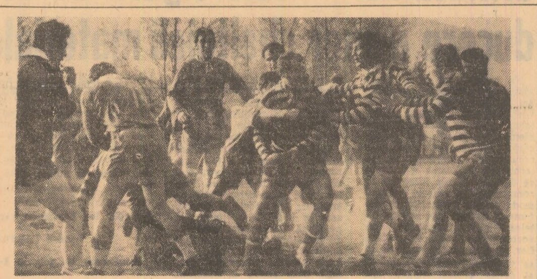
O fază care pledează elocvent pentru spectaculozitatea jocului de rugby...