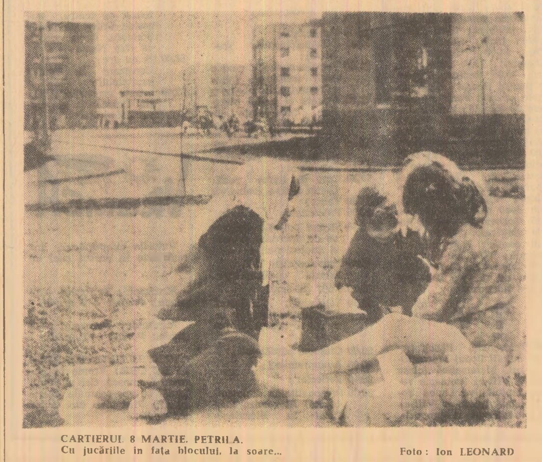
CARTIERUL 8 MARTIE, PETRIȚA. Cu jucăriile în fața blocului, la soare...