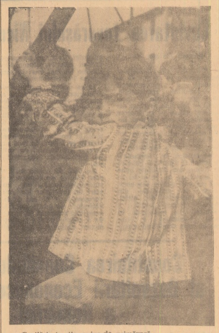
Copilăria în zile senine de primăvară.