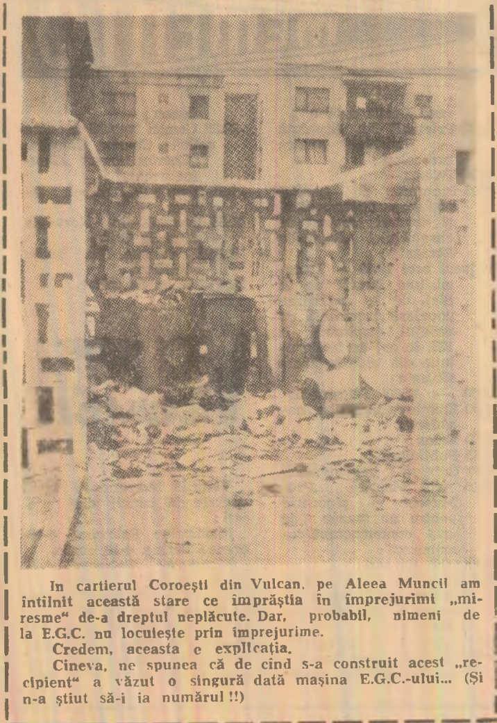
În cartierul Coroștii din Vulcan, pe Aleea Muncii am întîlnit această stare ce împărășia în împrejurimi „mirse” de-a dreptul neplăcute. Dar, probabil, nimeni de la E.G.C. nu locuiește prin împrejurimi. Credem, aceasta e explicația. Cineva, ne spunea că de cînd s-a construit acest „recliptant” a văzut o singură dată mașina E.G.C.-ului... (Și n-a știut să-i ia numărul!!)

finalul plenerii tovarășul Aurel Birlea, secretar al comitetului orășenesc de partid, accentuă faptul că activitatea cultural-educativă este muncă politică, pusă integral în slujba înfăptuirii programului partidului și poporului nostru de edificare a societății socialiste multilaterale dezvoltate. Lărgirea evantaiului tematic atractiv al activității cultural-educative de masă, înviorearea unor formații culturale-artistice tradiționale, o metodologie nouă, modernă, statornicirea unei zile a culturii vulcaniene cuprinzînd manifestări de amploare cu caracter tradițional, evitarea activității culturale în sine, caracterul permanent și militant al culturii de masă stabilit de amplul program ideologic elaborat de partid, antrenarea mai largă a intelectualității didactice, tehnice și medicale în viața spirituală a orașului — iată direcțiile de desfășurare a activității Comitetului orășenesc de cultură și educație socialistă, a tuturor organizațiilor de masă, într-o viziune prospectivă prin prisma înaltelor idealuri umaniste înscrise în programul de perfecționare a activității de propagandă politico-ideologică și de educație socialistă.