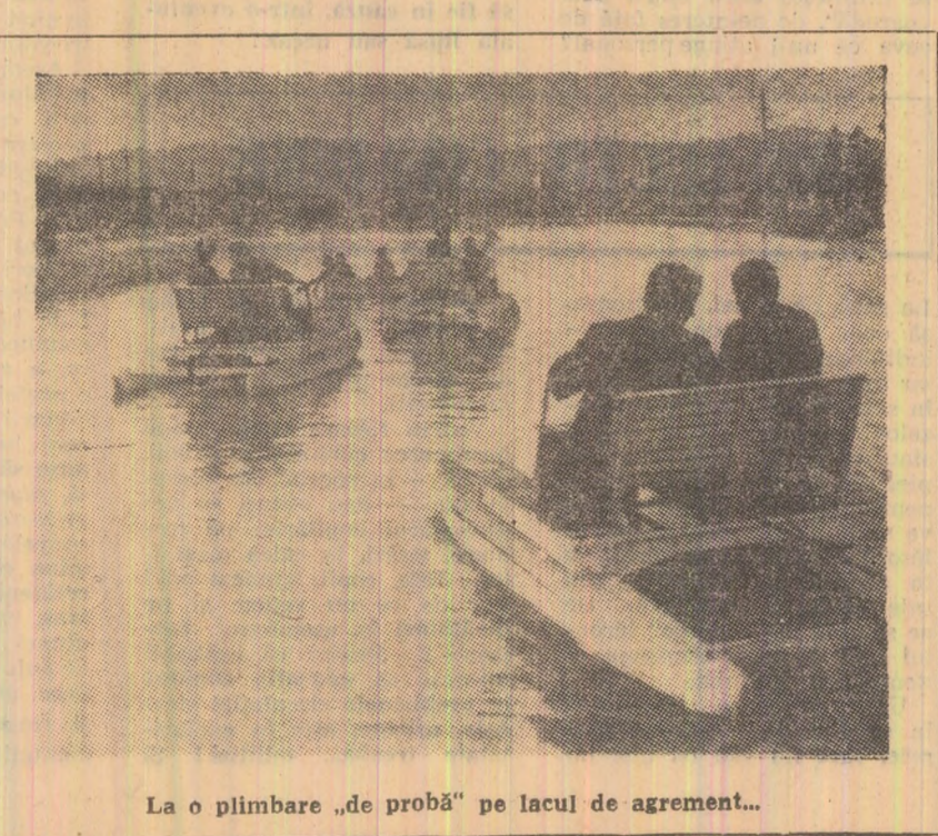
La o plimbare „de probă” pe lacul de agrement...

Răspunzînd unei necesități firești, lacul de agrement din Petroșani — menit să contribuie la îmbogățirea posibilităților de recreere a cetățenilor orașului — doțat fiind, pentru început, cu patru hidrobiociclete și șapte bărci cu vîle, este o expresie concludentă a modului în care sînt traduse în viață hotărârile de partid în domeniul sportului de masă.