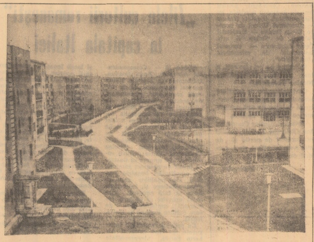
Cadru panoramic al cartierului Aeroport—Petroșani — o certă amprentă a constructorilor în lunca Jiului.